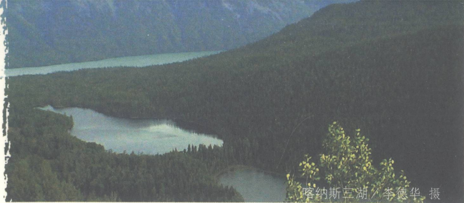
喀纳斯三湖

动较快的水，随着光线的不同，同一块水面色泽变化多端，有深蓝、乳白，有墨绿、豆青，各种色泽层次分明，清晰可辨。我走过不少地方，更见过各种各样的水，但这样的水，让人一见难忘。