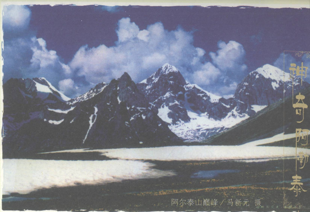
阿尔泰山巅峰