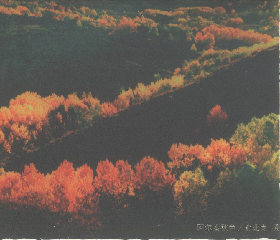
阿勒泰秋色

值此新疆维吾尔自治区成立50周年之际，阿勒泰地区编辑出版了一套反映本地区资源禀赋、区域特点、经济社会发展、人的全面发展丛书《中国黄金部落》，它包括风物散记卷：神奇阿勒泰；文化散文卷：天启阿勒泰；旅游随笔卷：行走阿勒泰；发展纪实卷：奋进的阿勒泰。丛书的作者，既有穆青这样享誉中外的新闻大家，也有知名作家郁笛、王族，还有不少游客和普普通通的阿勒泰人。作者们以独特的视角写出了自己眼中的阿勒泰。他们或在阿勒泰工作生活了几十年，或只是惊鸿一瞥。无论如斯如是，神奇的山水，淳朴的文化，历史的变迁都深深地嵌