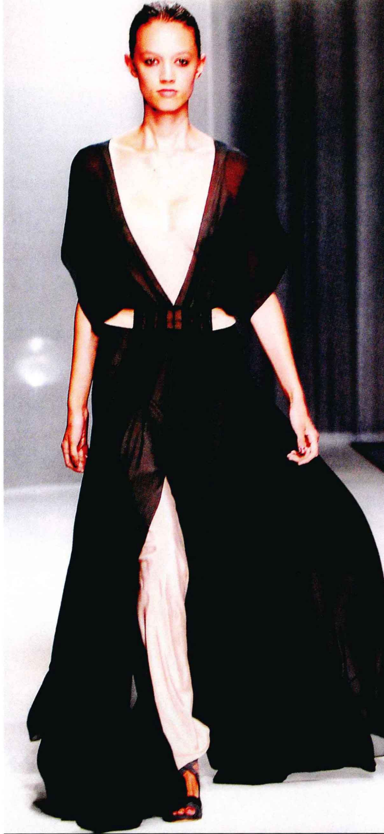
图1-14 无彩色可以独立地作为服饰搭配的主角

如图1-13所示，无彩色系服饰是指黑色、白色以及不同程度的灰色系列。无彩色系服饰有着自身的特殊性，即只具有明度因素，没有色相和纯度因素。也许是因为无彩色系的特殊性决定了它们在色彩关系中的特殊作用，也使得在服饰配色中无彩色系既可成为主角（图1-14），也可成为配角（图1-15）。黑、白、灰不仅能够单一使用，同时也能够与有彩色系搭配，如图1-16所示，在充分显示自身魅力的同时，使个性强烈的多彩色易于协调，起到衬托、辅助它色的作用。