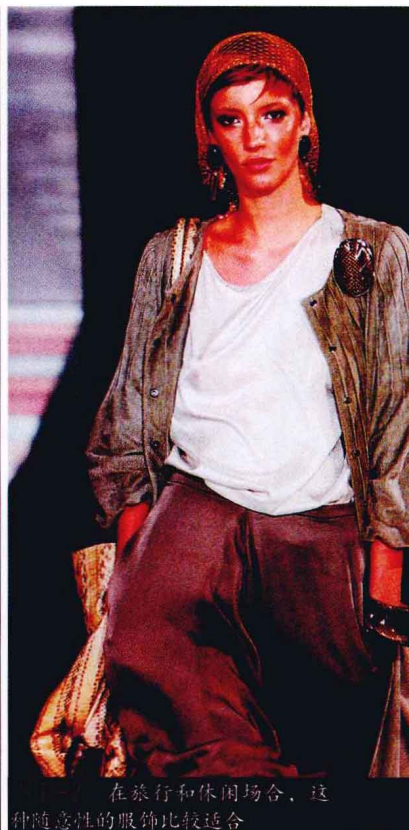
在旅行和休闲场合，这种随意性的服饰比较适合