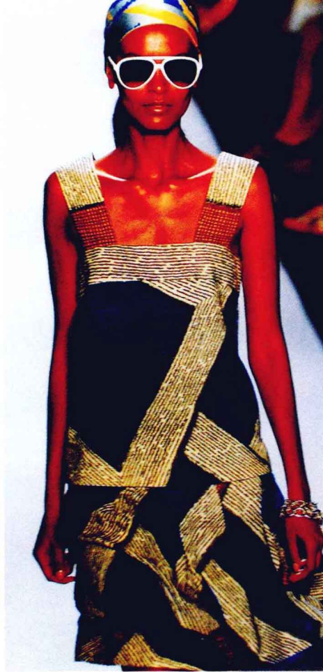
图1-4 偏黑棕色肤色的人，使用纯度高和中明度的色彩与其搭配，将肤色与服色达到一种平衡的对比调和状态。