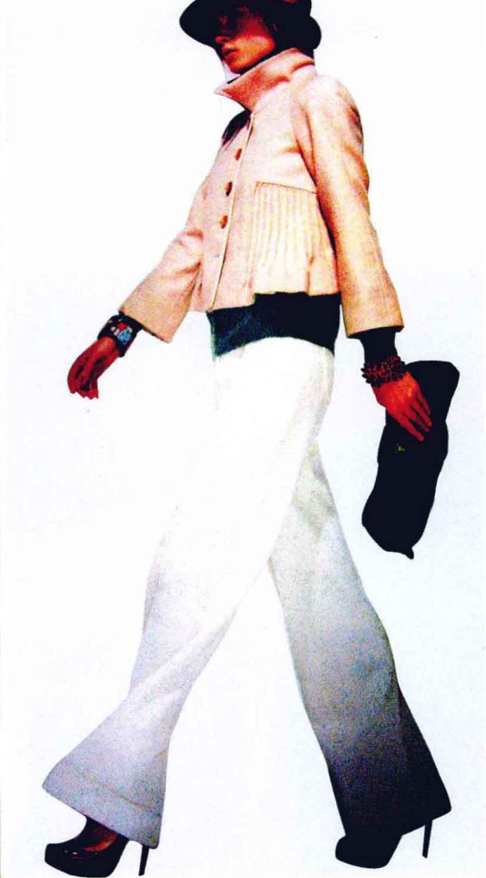
图1-3 无彩色的黑色鞋帽分别搭配在人体的最上和最下处，纯度高的绿色搭配在中间，明度高的米色上衣和白色裤子分别搭配在绿色和黑色之间，黑色帽饰上高纯度红色的使用，既打破了黑色的寂静，也照应了孤寂的高纯度绿色，使得整体色彩搭配协调、美观。