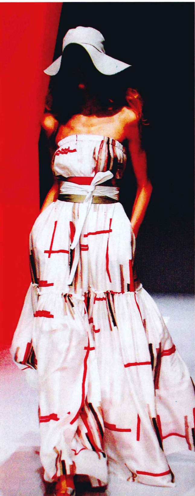
图 1-1-5 全黄的发色，白中偏桃红的肤色与明度高的服饰色彩搭配，将服饰与人自身的色彩协调得唯美至极