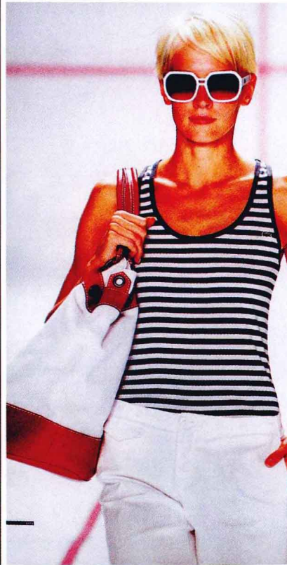
图 1-1-8 服饰搭配设计根据人自身的特点和所处的时代社会性等，搭配其相应的色彩服饰