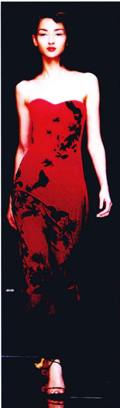
图 1-1-6 在晚会场合，就需要礼服类的服饰与之相配合