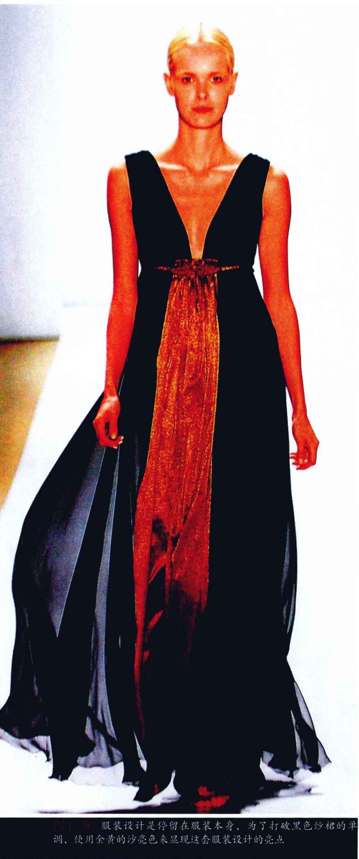
图1-9 服装设计是停留在服装本身，为了打破黑色纱裙的单调，使用金黄的沙亮色来显现这套服装设计的亮点