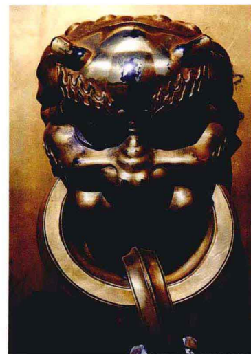
01 01. 铜缸局部

The Palace Museum, also known as the Forbidden City, is the only existing example of China historical imperial palace with the largest scale, highest rank and most completely preserved architectural complex in the world. In March 1961 the Palace Museum was designated by the State Council as one of China's foremost-protected cultural heritage sites, and in December 1987 was made a UNESCO World Heritage site. The Forbidden City covers an area of 720,000 square meters, with a 52-meter-wide moat surrounded on four sides. Four pierced gates face four directions and a watchtower with a double-eave roof covered with yellow glazed tiles stands at each corner. The footprint of the architectural complex inside the Forbidden City is 157,577 square meters, spreading out on either side of an invisible central axis. The southern portion is known as the Outer Court, centers on three main halls — Hall of Supreme