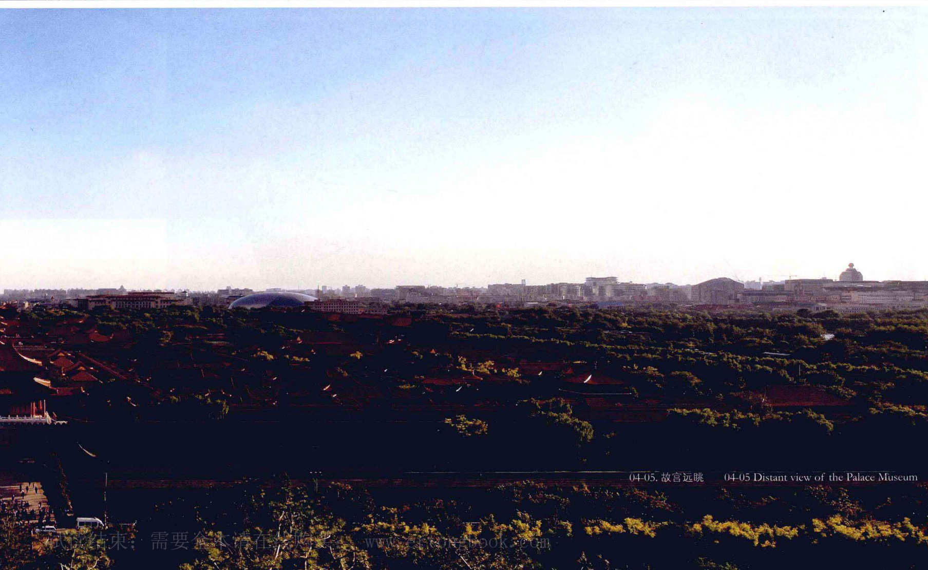
04-05. 故宫远眺 04-05 Distant view of the Palace Museum