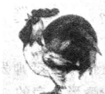
圆圆嘴巴 o o o