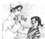
张大嘴巴 a a a