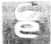
扁扁嘴巴 e e e