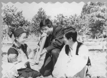
在云南西双版纳采风留影