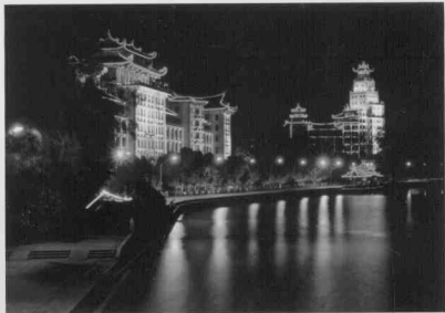
南侨之光——集美学村的嘉庚风貌建筑群