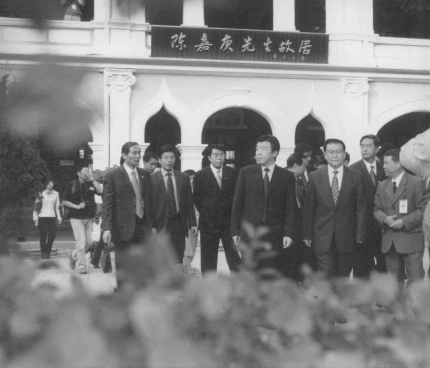
春天的故事——中共中央政治局常委李长春在厦门集美陈嘉庚故居