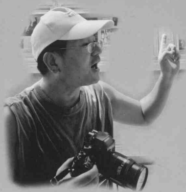
相机是他的战斗“武器”