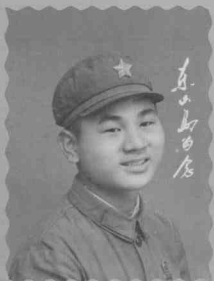
1968年作者17岁时投笔从戎