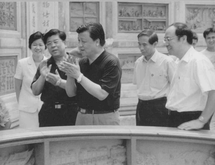
刘云山的掌声——中共中央政治局委员、中宣部部长刘云山在厦门集美鳌园