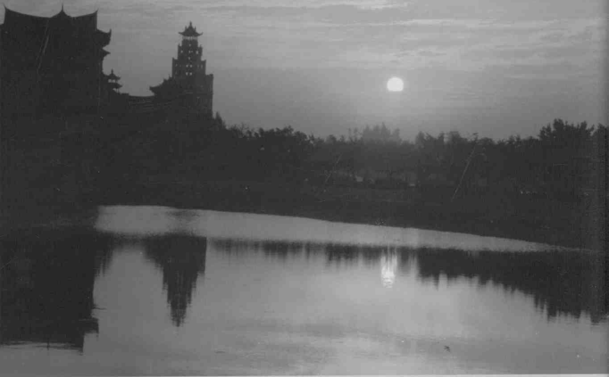
南薰楼日出——厦门集美风光