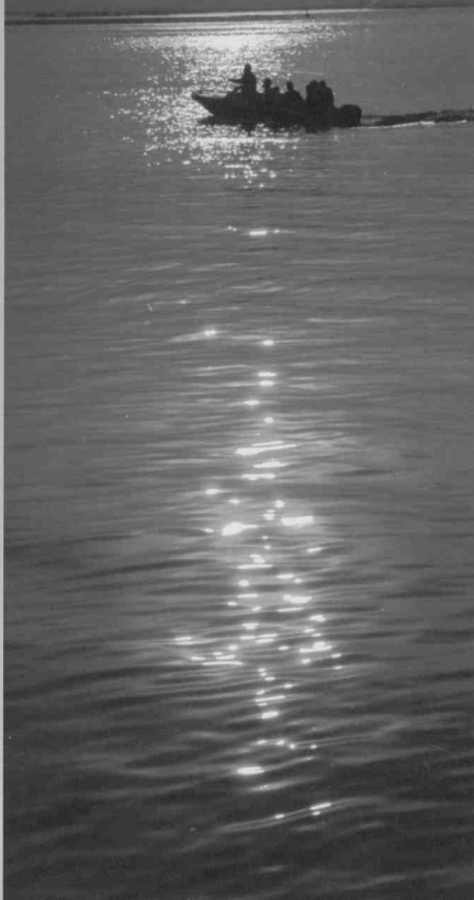
杏林湾夕照 (厦门中洲岛中国园博园)