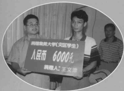
维权胜诉将赔偿款资助贫困生