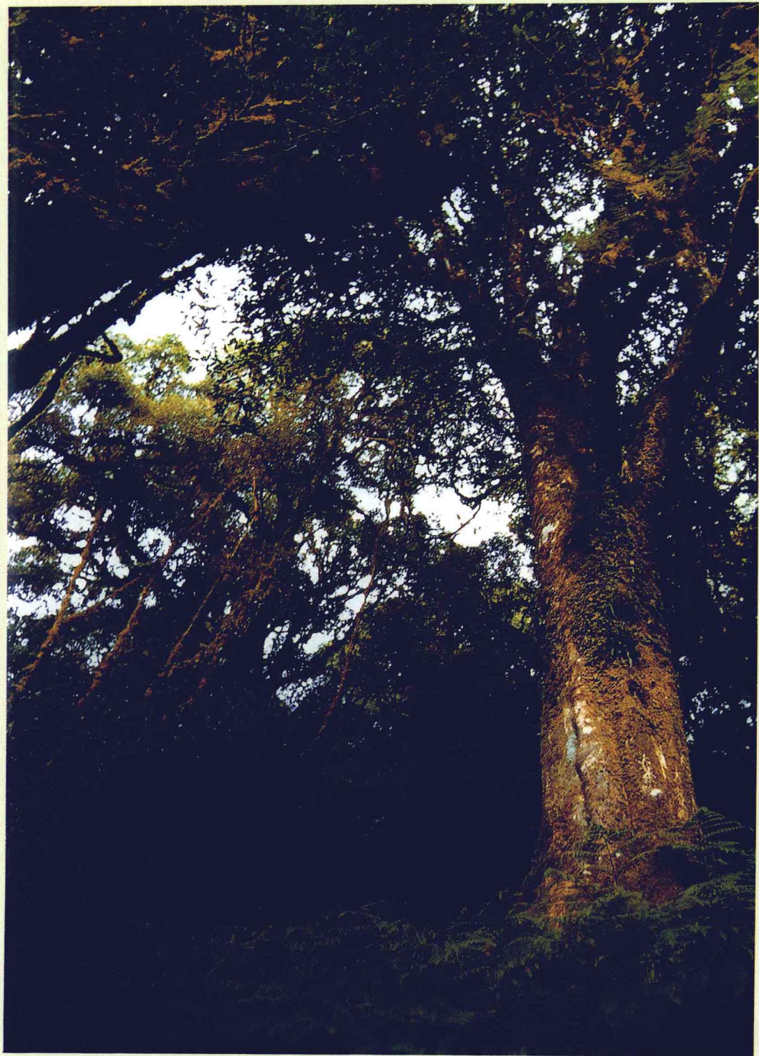
云南哀牢山野生大茶树