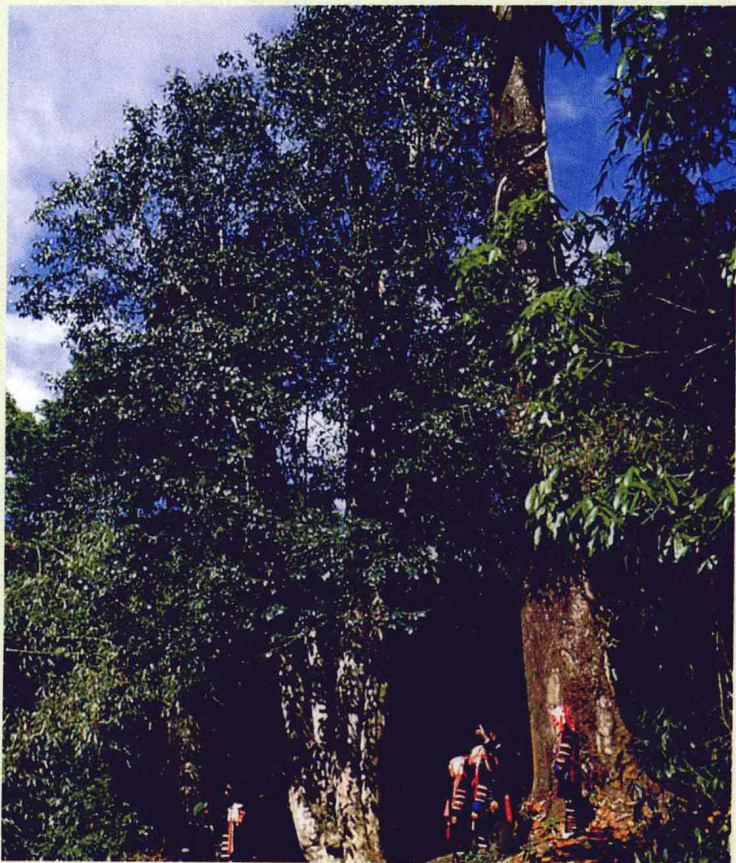
云南西双版纳巴达山的野生大茶树