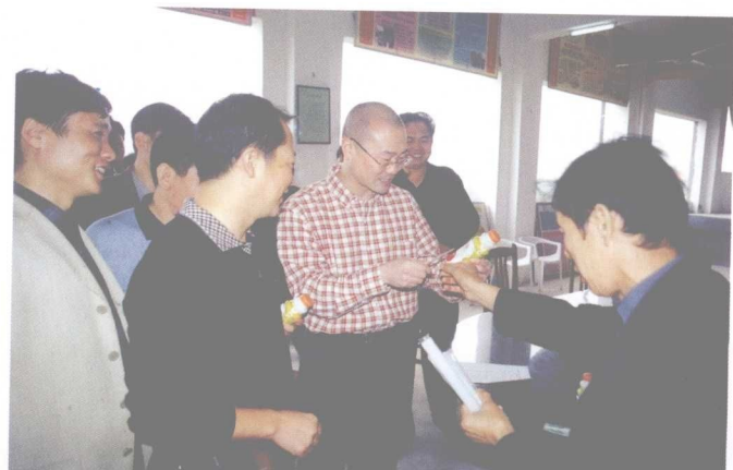
县委副书记、县长白一峰（左三）到企业检查工作