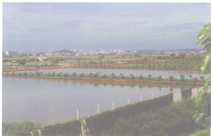
大力调整农业 产业结构，发展连 片养鱼基地