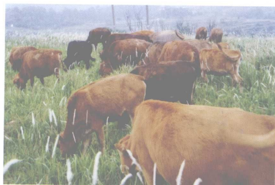
利用草地资源，发展菜牛生产