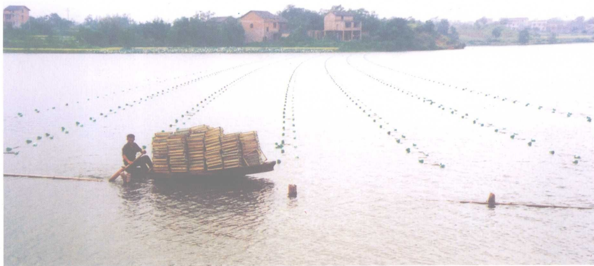
大力发展特种养殖，图为水面养殖珍珠