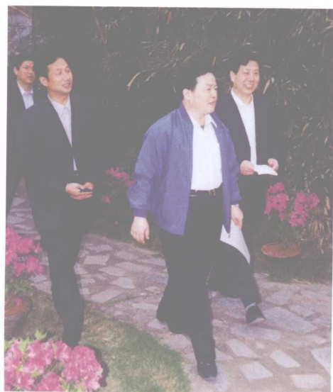
2001年，原县委书记谢恒斌（右一）陪同省长周伯华（前排中）到农村视察工作