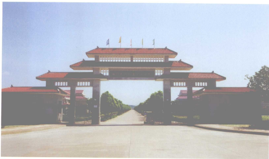
坐落于县城英陂的衡阳市现代农业示范园