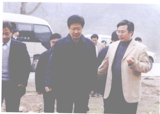
县委书记邹文辉（右一）陪同省委书记张春贤（中）视察工作