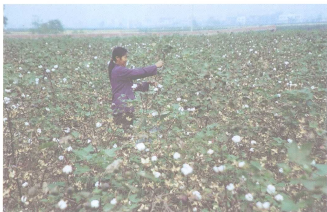
全县发展优质棉 生产基地15个，面 积达10万亩