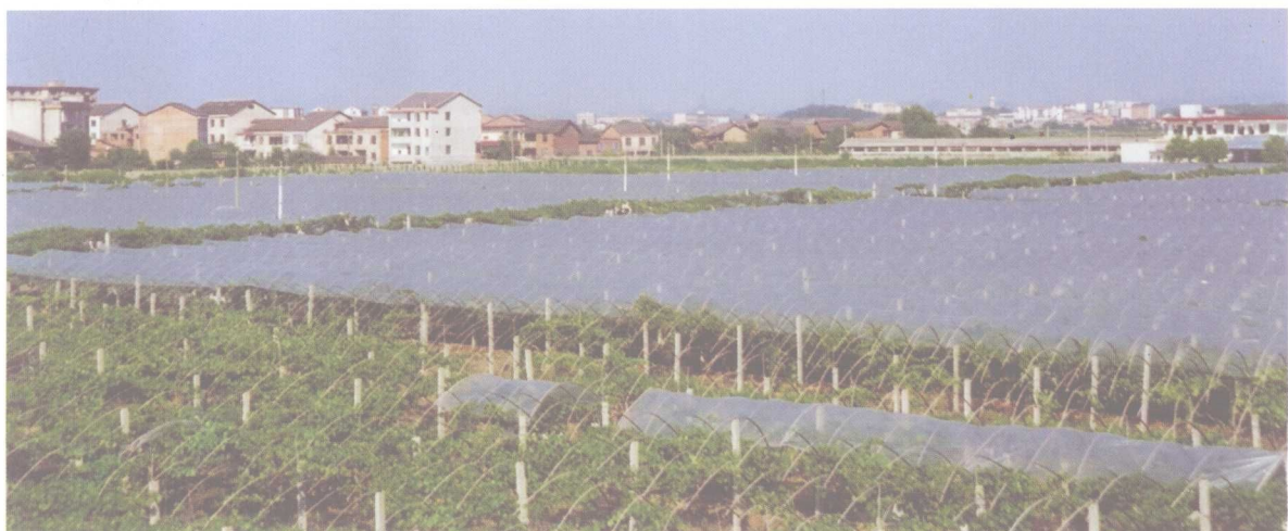
连片种植的红提生产基地