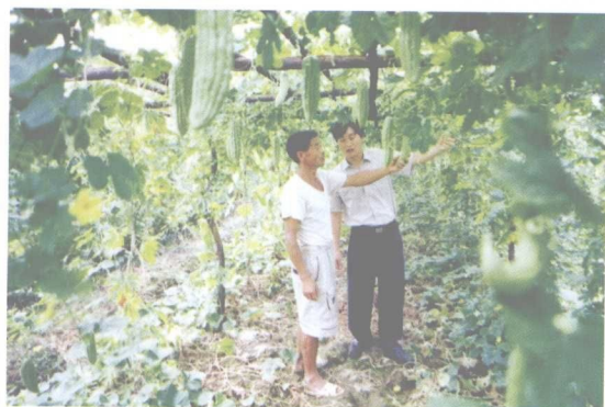
调整种植结构，发展蔬菜生产