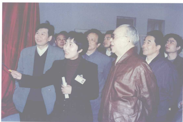
1996年4月，原县委书记易佩康（左一）陪同全国人大副委员长廖汉生（右一）、省人大主任刘夫生（二排右一）视察民营企业