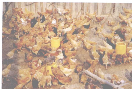
湘黄鸡专业养殖户