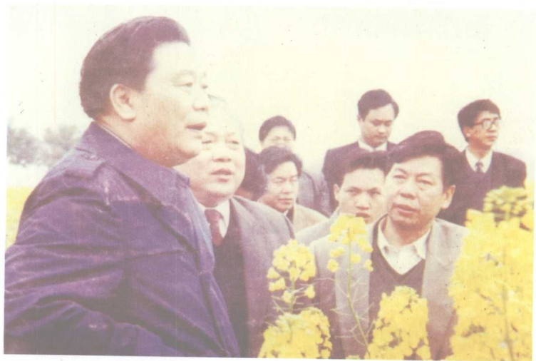
1995年3月，原县委书 记彭辉（二排左一）、原 县长易佩康（右一）陪同 省委书记王茂林（左一） 视察油菜生产