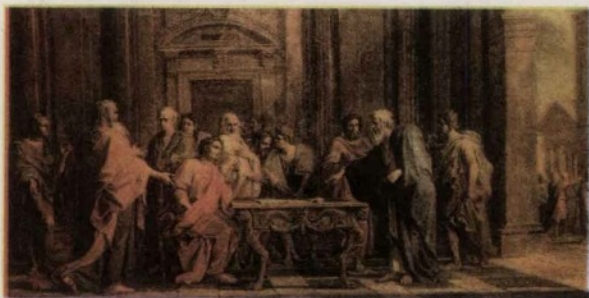
梭伦改革前夕,雅典贵族展开激烈的辩论。

梭伦规定,除橄榄油以外,禁止任何农作物出口,以保证有足够的农产品供本国居民需要。禁止婚丧节庆的仪式过分铺张。他制定法律,规定雅典公民必须让儿子学会一种手艺,并鼓励有技术的外国手工业者移居雅典城,授予他们公民权。他改革雅典的币制,统一度量衡。这些措施有利于提高雅典在对外贸易中的竞争力。