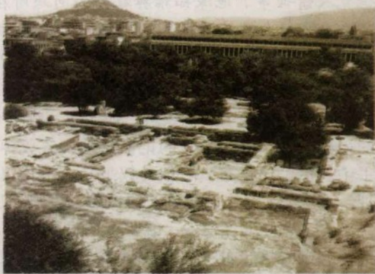
▲ 雅典广场及其附属建筑一角。广场是公民活动的主要场所。

贵族政治不仅彻底废除了个人独裁、世袭制、终身任职制，建立了集体统治的法治原则，而且在民众中树立了一种新观念：对于谋求王权者，人人得而诛之，从而为国家权力的进一步下移提供了可能性。