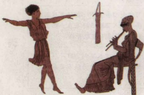
▲ 雅典人的舞蹈教育

伯里克利改革的一项重要内容，就是限制取得雅典公民的身分。公元前451年规定，只有父母双方皆为雅典公民者才能获得公民权。在雅典全国大约20余万人口中，能够充分享有民主权利的只有约三四万男性公民，他们仅占总人口的大约1/5或1/6。大量奴隶、妇女和外邦移民被摒弃于雅典民主政治之外，所以，雅典民主不是全社会所有成年人的民主。