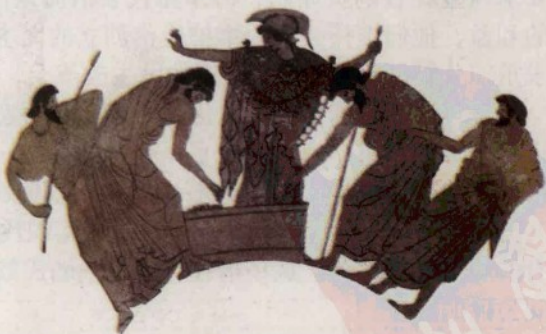
▲ 一种民主表决的方式：在雅典娜女神的监督下，雅典人用石子投票表决。

战神山议事会仅保留审判谋杀案和渎神案的职能。公民大会及五百人议事会和公民法庭成为雅典国家的最高权力机关和执行机构。