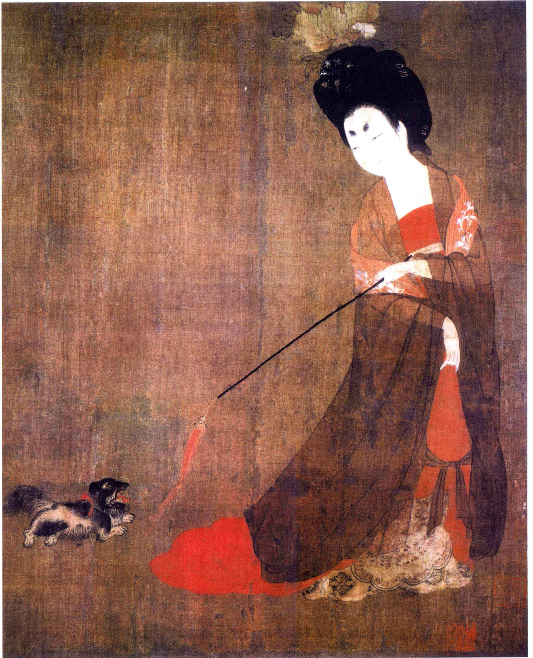
《簪花仕女图》原作局部