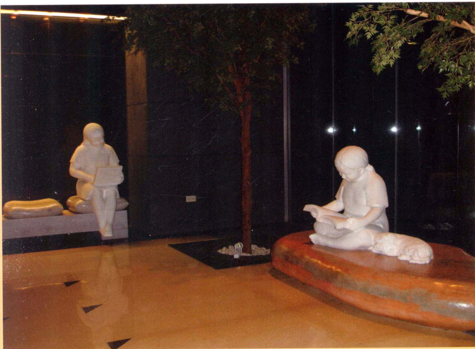
台北市和平東路國立編譯館大廳王秀杞作品〈百年樹人〉

〈百年樹人〉表現兒童閱讀的樂趣，從入口到大廳是以健康理想的主题創作，小孩旁邊有一隻小狗。該大廳有警衛管理，不知若是真有小朋友帶小狗坐在那裡閱讀，會被允許嗎？