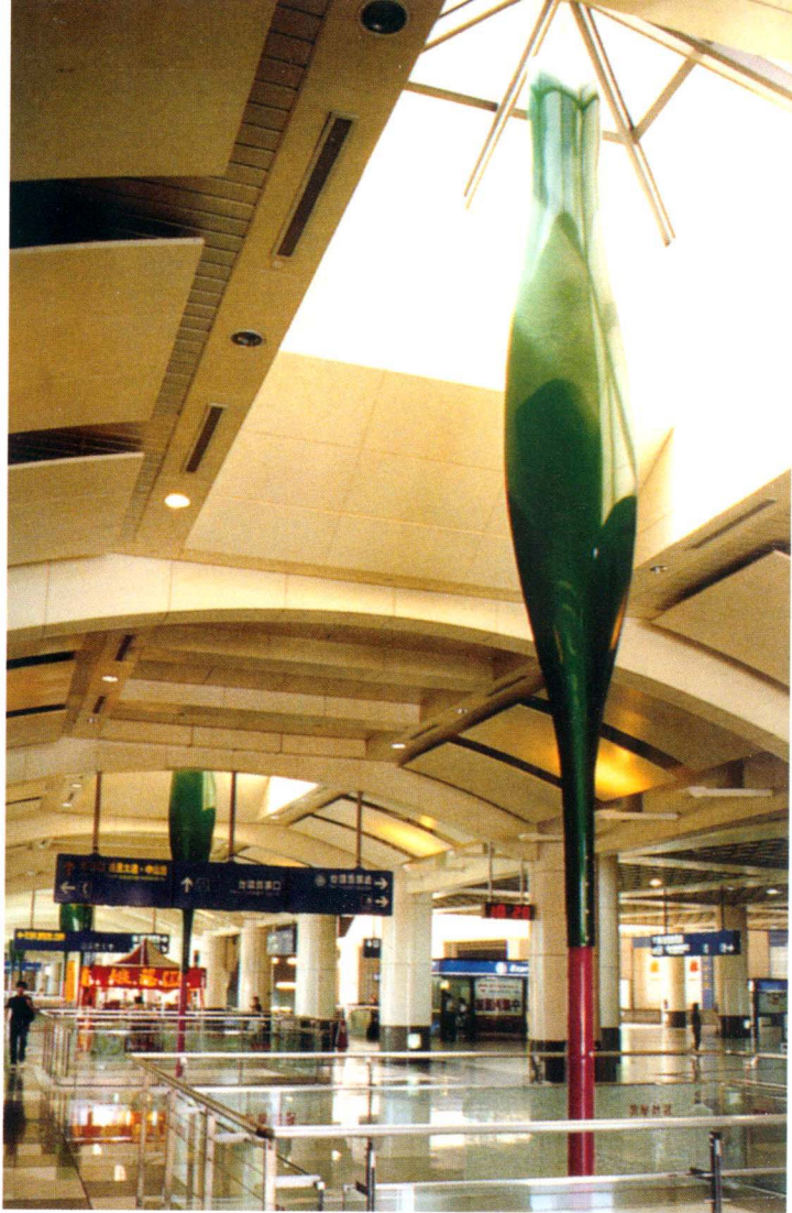
在板橋車站看起來像是機具形式放大的美學表現，是製作精緻的裝飾性中性美學。(黃健敏攝，右圖)

術 (site-specific art work)。美國廿世紀七〇年代之後，從社會文化的觀點，做了許多與社會生活相關公共藝術的嘗試，並且與當代藝術新思潮的前衛美學理論相契合。身為日本著名公共藝術策展人的南條史生認為：「從事公共藝術創作時，必須非常重視對話。公共藝術的存在對於人類文化、社會，絕對是為『生存價值』提供理由的唯一方法。」(註1)