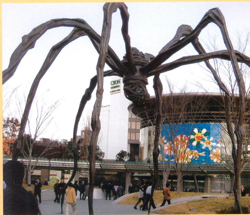
路易絲·布爾喬亞 (Louise Bourgeois) 的作品〈蜘蛛〉，黑色八隻巨腳、張力十足地盤據在日本六本木「森之塔」的入口廣場前，這件作品對當今商業區形成的衝擊，是一種重返物種多樣文化、不同價值觀的展現。它，深深吸引人們的目光，凝聚焦點，成為地標。

〈百年樹人〉表現兒童閱讀的樂趣，從入口到大廳是以健康理想的主题創作，小孩旁邊有一隻小狗。該大廳有警衛管理，不知若是真有小朋友帶小狗坐在那裡閱讀，會被允許嗎？