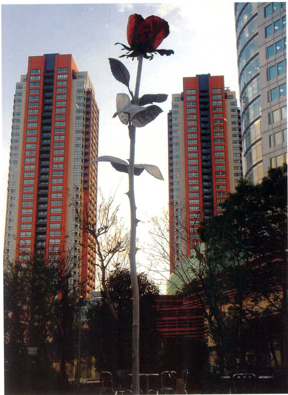
矗立在日本六本木森大樓斜對面戶外庭園咖啡座中庭的〈玫瑰〉，這是德國女藝術家愛莎·根澤肯（Isa Genzken）的作品。玫瑰酷似真品花朵，經脈畢現，這種既熟悉、又誇張的巨型真實，實令人印象深刻。

義者，否則就消失了文化觀察的前衛性。馬庫色（Herbert Marcuse）的極理想說法：菁英主義有一種激進的內涵，革命的藝術可能成為「人民之敵」。也就是說草根不等同於大