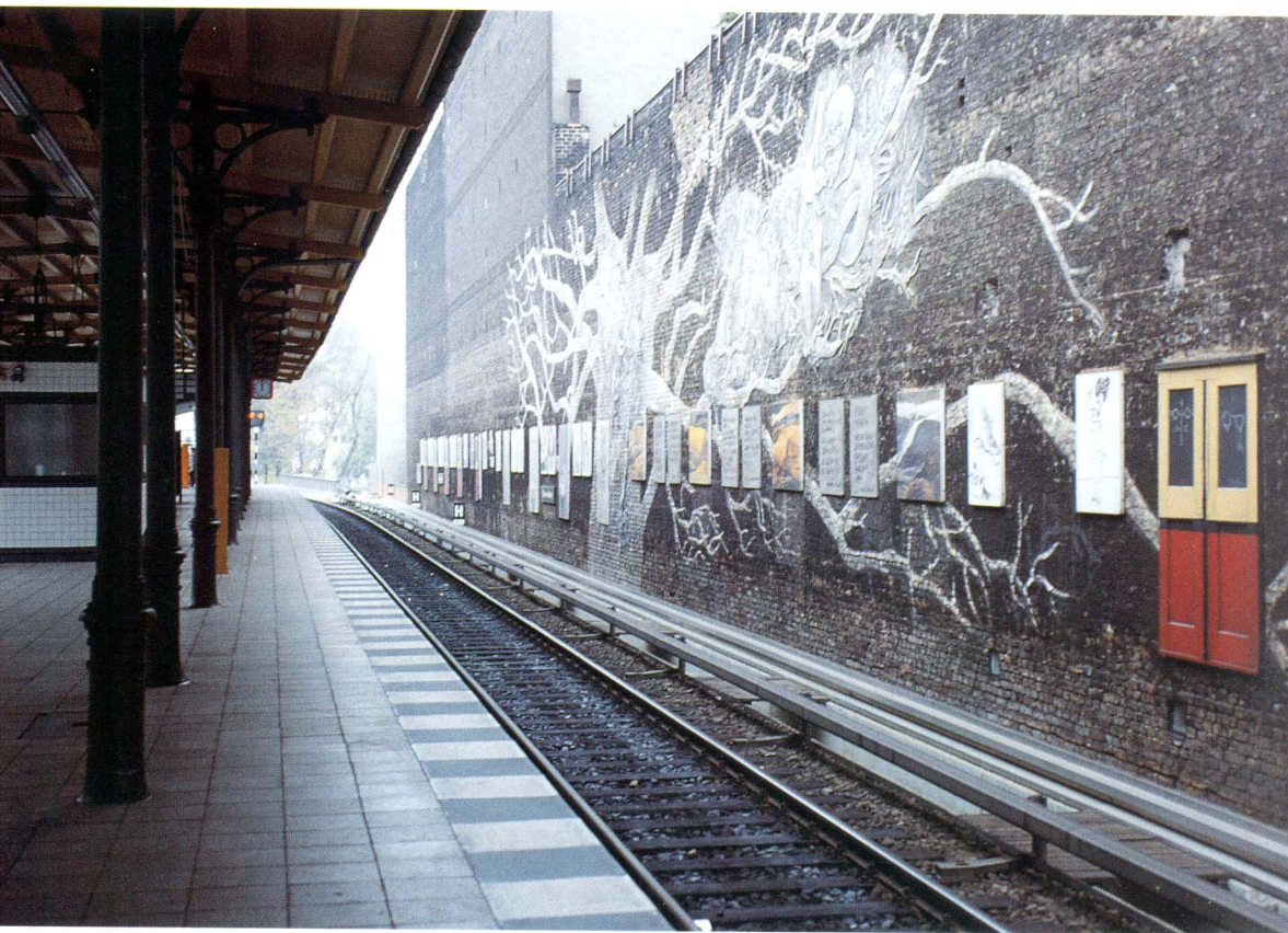
德國柏林市地鐵站壁面與生態環境相關的內省性公共藝術