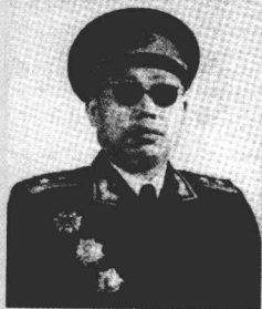
/ 韩先楚 / 李作鹏

任红4军特务连、卫生队党代表等。1929年1月，随红4军从井冈山突围到赣南、闽西打游击，先后任红4军第2纵队4支队政治委员、第12师参谋长、第13军37师政治委员等职。解放战争时期，任东北民主联军第1纵队政治委员、东满军区副司令员、东北野战军第6纵队政治委员、四野43军政治委员、第15兵团政治委员。中华人民共和国成立后，历任中国人民解放军总干部部第一副部长、北京军区政治委员、沈阳军区第二政治委员等职。