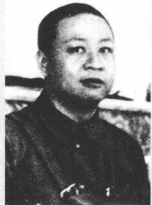
/ 薛岳 / 陈济棠 / 余汉谋