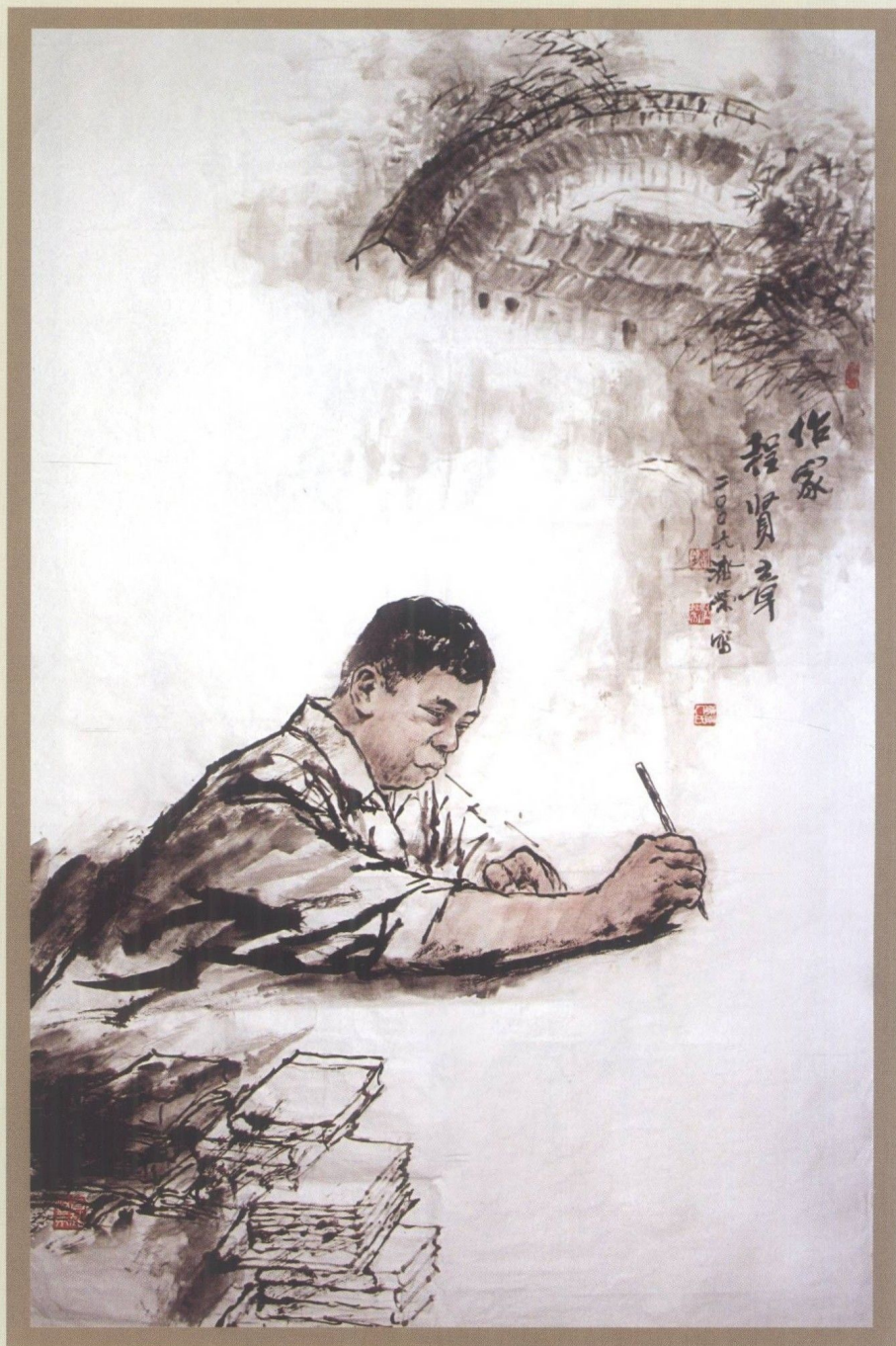
广州美术学院教授、著名画家刘济荣为程贤章造像作