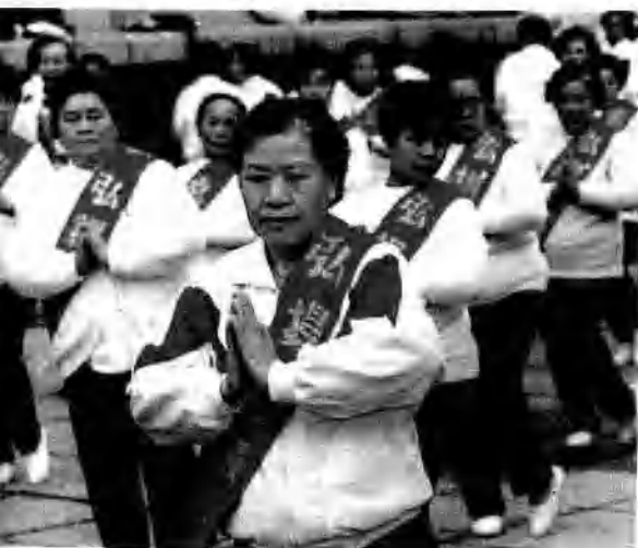
开元分校表演《弘扬元极功》