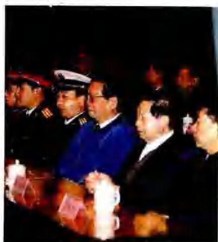
出席校庆十周年大会的各级领导