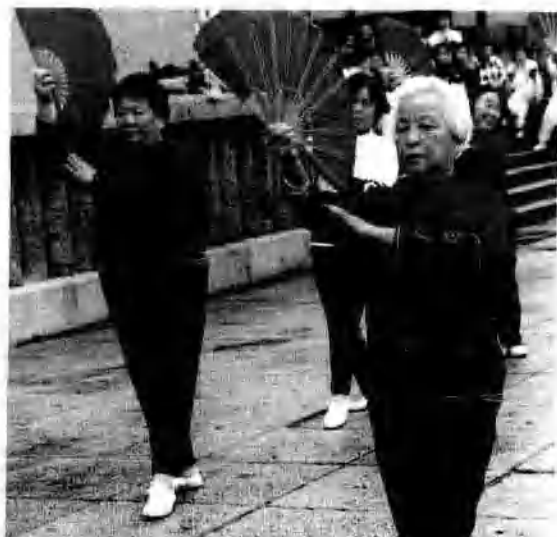
鼓浪屿教学区表演《扇舞》