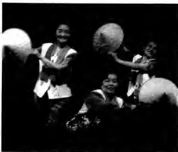
思明分校表演《希望之光》