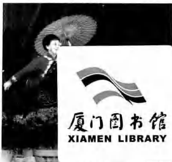
总校健美操表演《浏阳河》