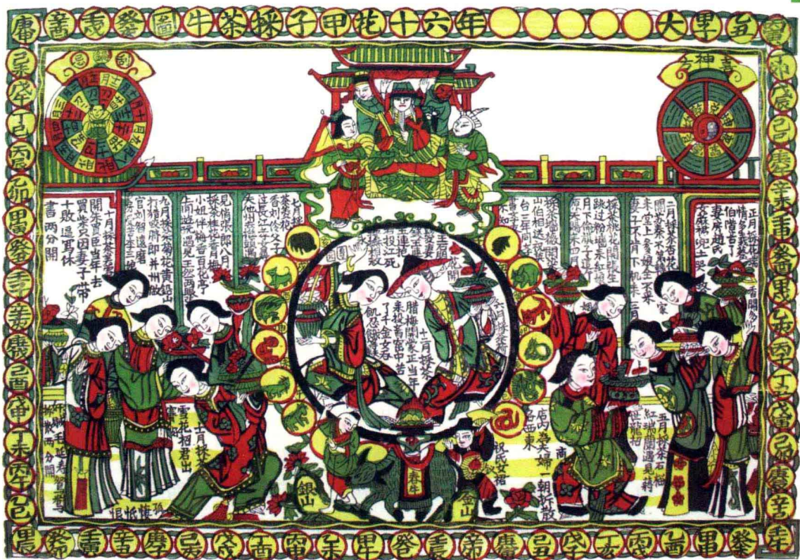
《六十花甲》。桃花坞年画。