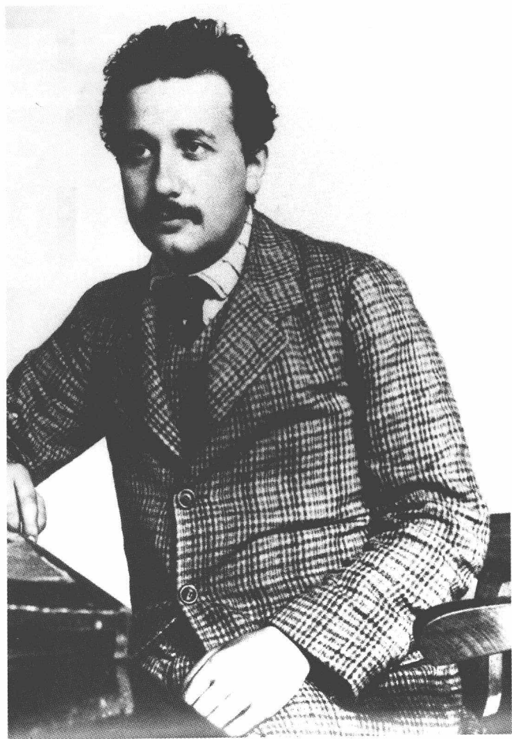
1905年(爱因斯坦奇迹年),在伯尔尼瑞士联邦专利局办公室