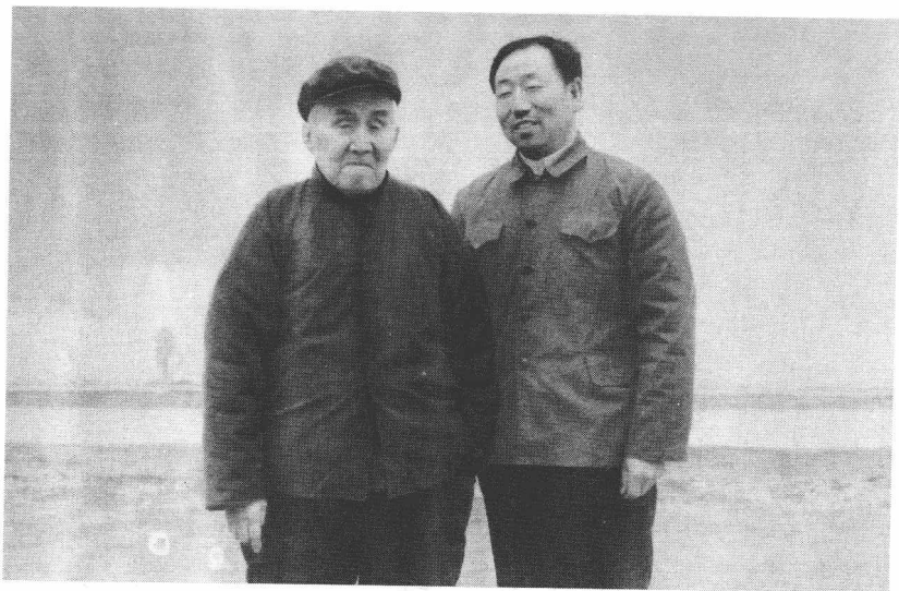
1978年3月，作者与著名太极拳名家洪均生恩师（左）合影