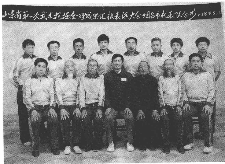
1984年5月，作者（后右四）代表“牛郎门”同烟台地区其他武术门派掌门，于青岛参加山东省第一次武术挖掘整理成果汇报表演大会