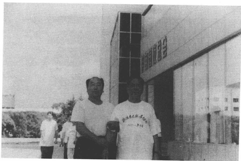
作者与中国著名武术家冯志强师叔（右）合影