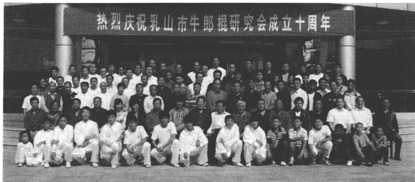
2008年10月3日，作者（二排右六）在乳山市牛郎棍研究会成立十周年纪念大会上与领导及部分弟子和学生合影