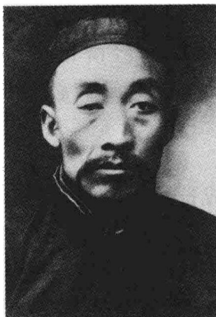
毛泽东的父亲毛顺生 (1870—1920)、母亲 文素勤 (1867—1919)