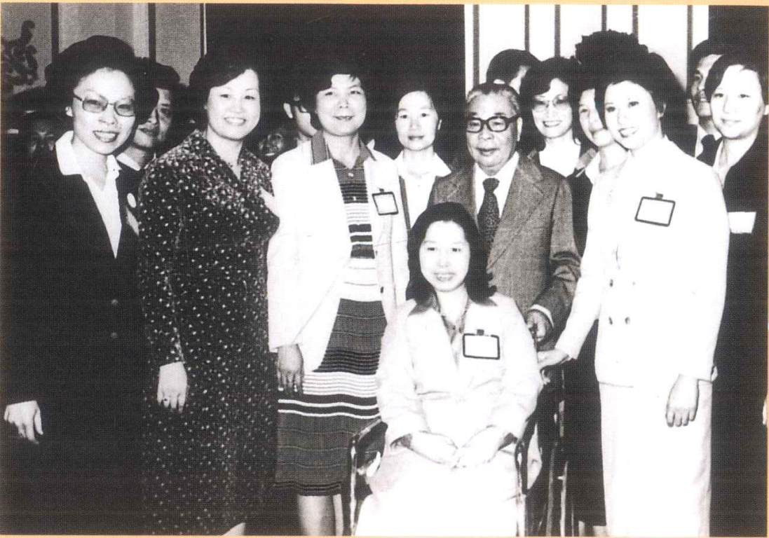
▲ 蔣故總統經國先生親自接見當屆十大傑出女青年，由於我是與會中唯一坐輪椅者，經國先生特地過來推我，並親自夾點心給我，態度親和。（1980年）