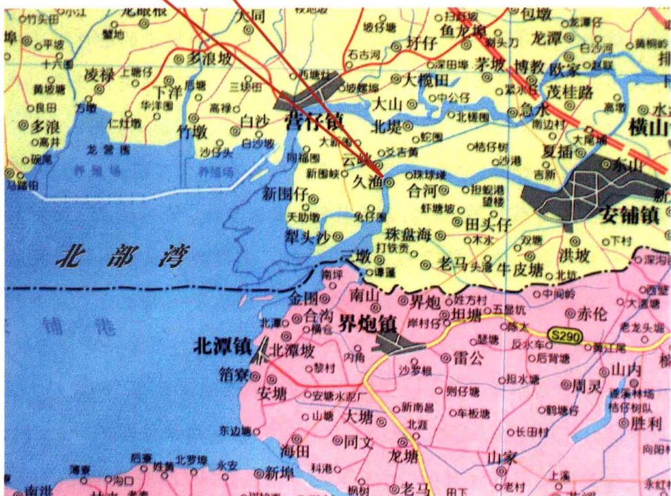
久受埔村(久渔)地理位置图

方圆约1.5平方公里的久受埔村，地处粤西廉江市的南部，位于雷州半岛北端的九洲江口，是湛江廉江市安铺镇管辖的一条行政村。它东靠著名古埠安铺镇，北面与营仔镇接壤，南面与遂溪县介炮镇、北潭镇遥遥相望，西边面对浩瀚的北部湾，是安铺港口一条古老的渔村。