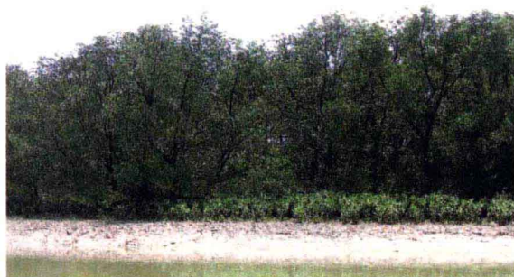
引进的孟加拉红树林