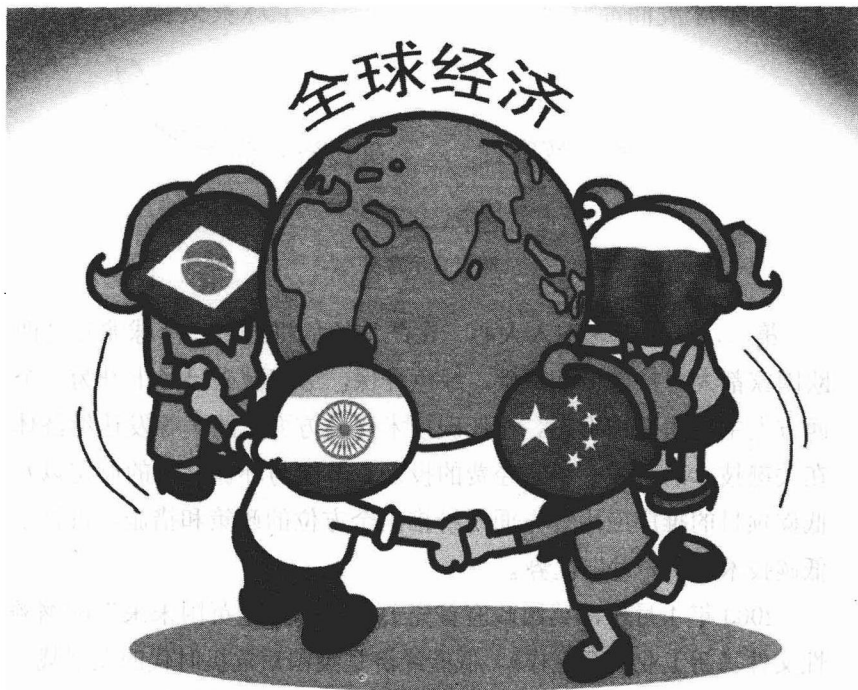
金砖四国成全球经济复苏新引擎（中新社发 宋学海 作）

份额改革说明世界经济和金融版图正在发生重要变化。应当看到，尽管 IMF 和世界银行的份额改革值得肯定，但西方发达国家掌控世界经济和金融体系高端决定权的格局一时难以改变。美国在 IMF 现持有 17.67% 投票权，仍有否决权，IMF 五大权力国美国、日