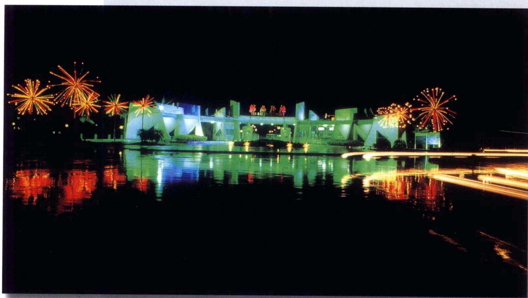
银滩夜色