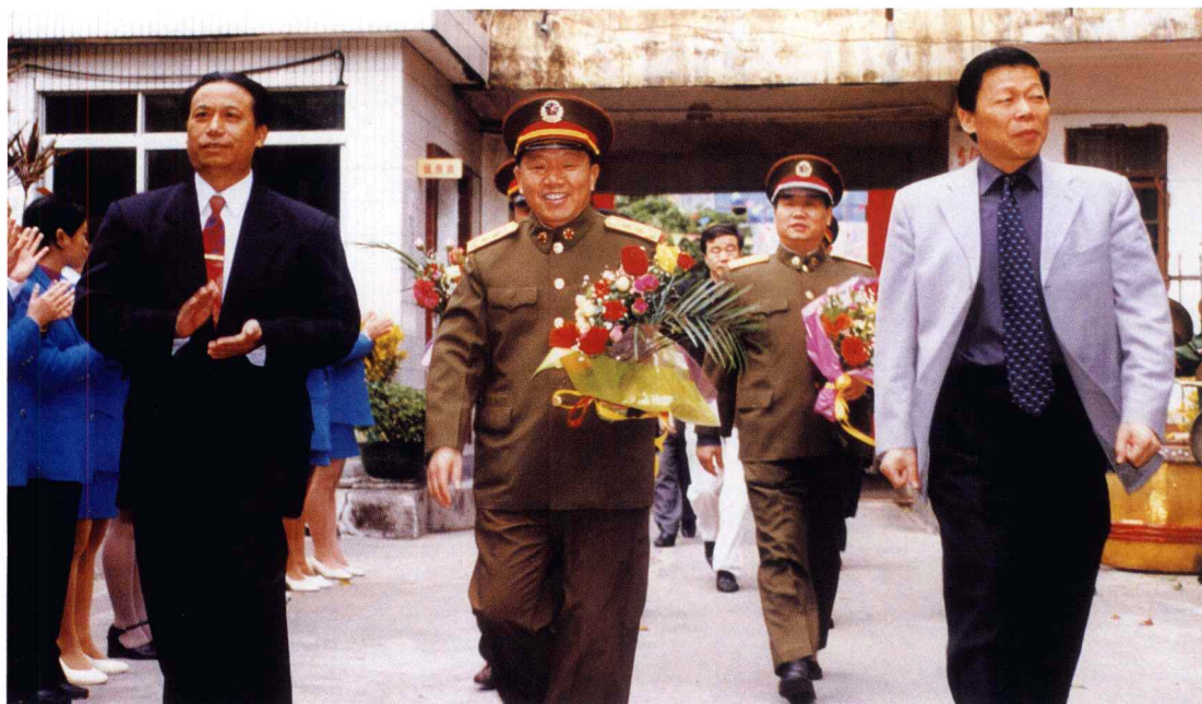
2002年12月8日，广州军区副政委张国初中将率团到北海市检查双拥工作，并同意推荐北海市为“全国双拥模范城”候选城市。图为张国初中将在市委书记温卡华的陪同下，到基层检查工作