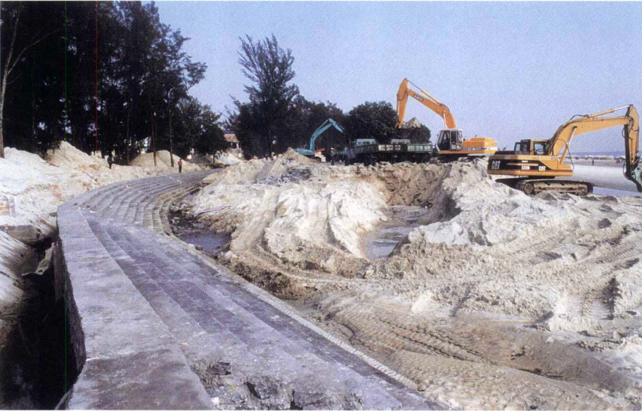
建设银滩新护堤