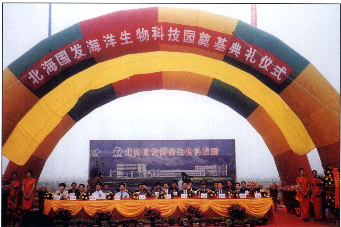
北海国发海洋生物科技园奠基礼仪式