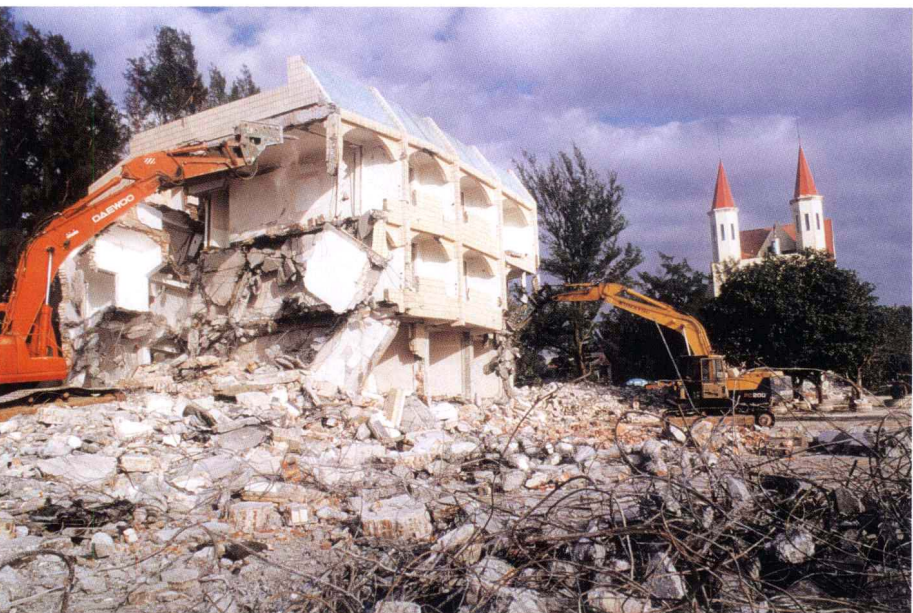
拆除银滩旧建筑