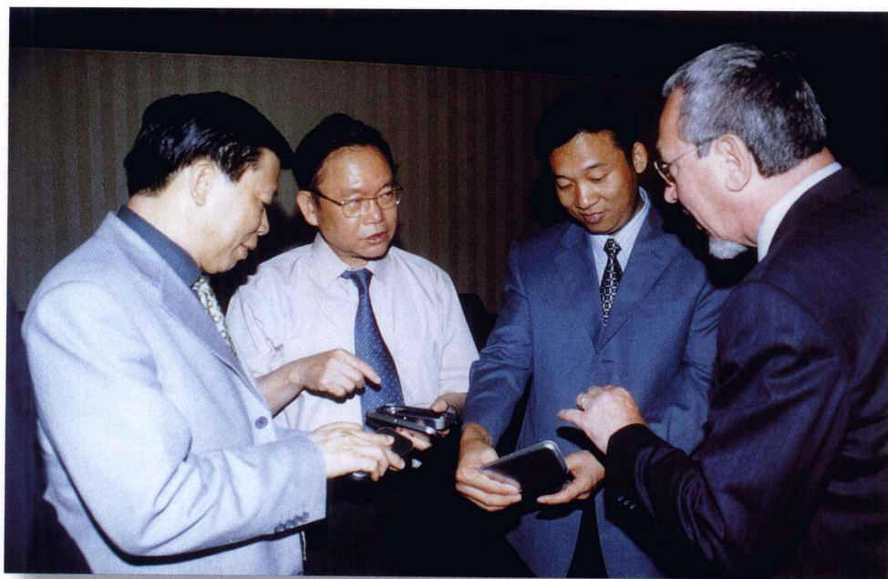
市委书记温卡华、市长刘君、前中国驻德意志联邦共和国大使卢秋田与德国朋友在亲切交谈