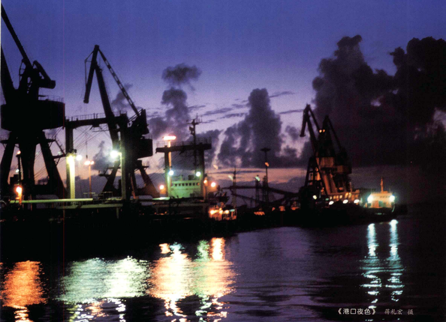
《港口夜色》