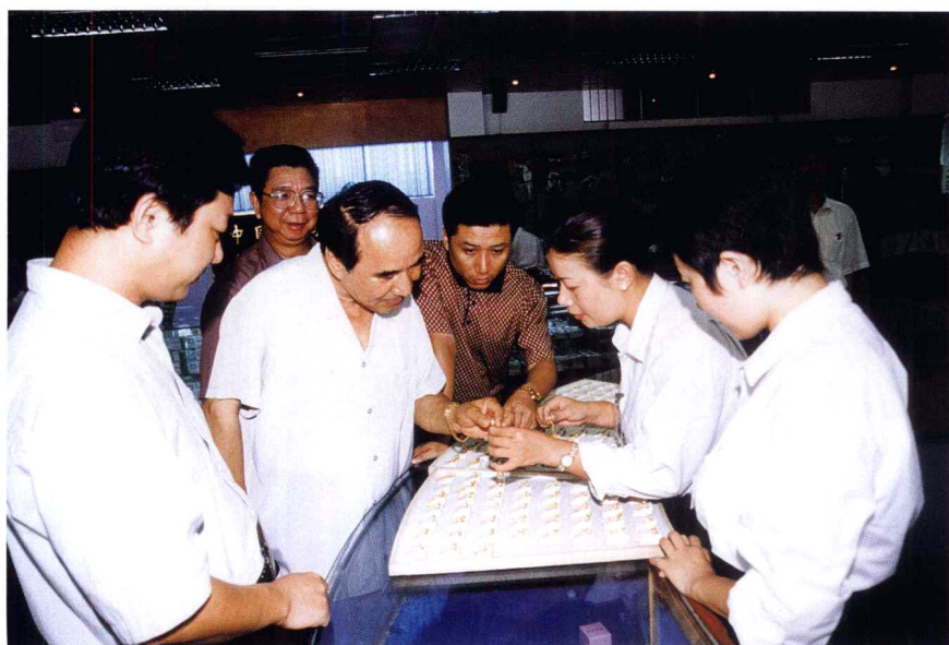
2003年7月19日，全国政协副主席阿不来提·阿不都热参观北海南珠宫