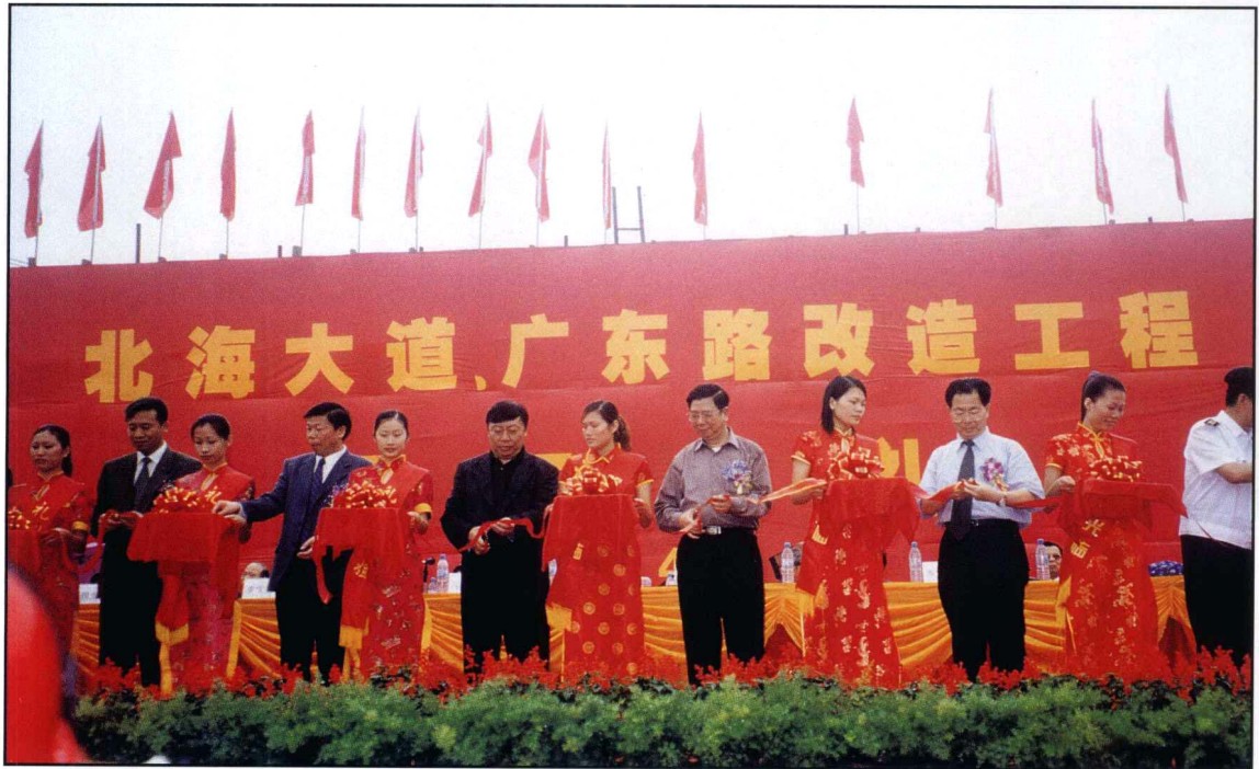
北海大道广东路改造工程剪彩开工