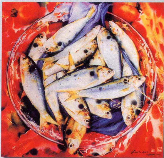
得鱼图（水彩） 张国楠