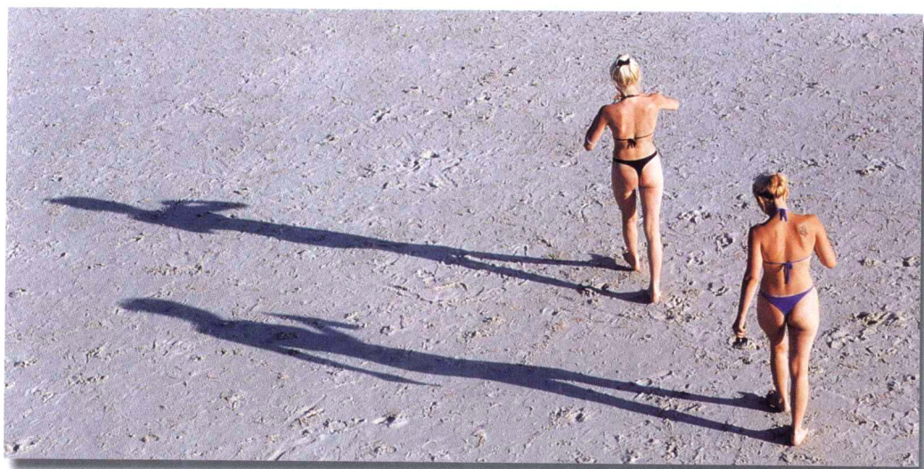
银滩丽影