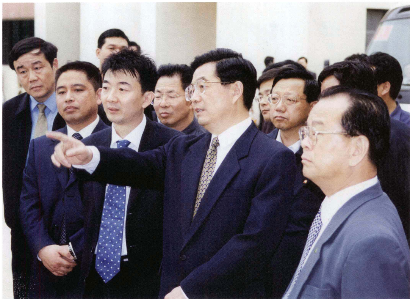
2002年3月29日，中共中央政治局常委、国家副主席胡锦涛视察北海银河科技