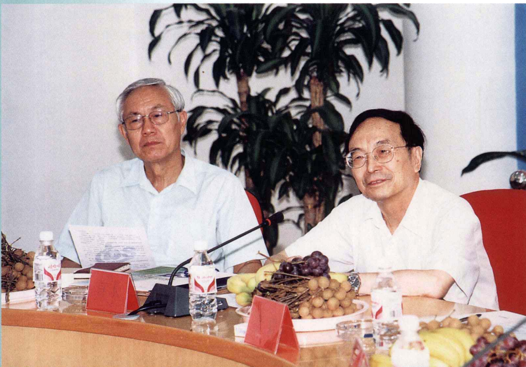
2002年7月24日，全国人大常委会副委员长蒋正华（右）视察北生科技园