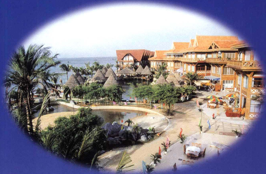
外沙岛海鲜城一瞥