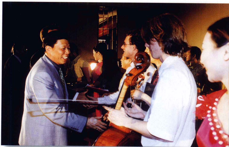
市委书记温卡华与参加北海国际经济文化交流会文艺晚会演出的外国朋友亲切握手，祝贺演出成功