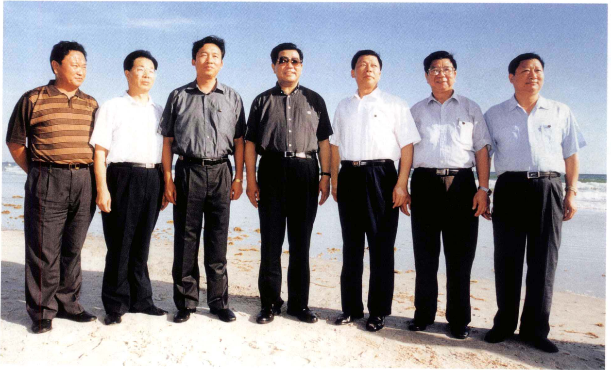
2003年5月15日，中共中央政治局常委、全国政协主席贾庆林视察北海期间与北海市委书记温卡华、市长刘君等有关领导在改造后的银滩合影留念