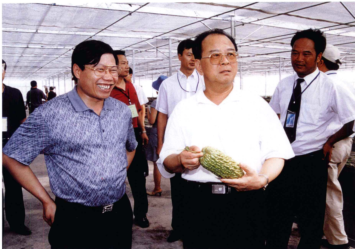
2003年7月10日，广西区党委书记曹伯纯（左二）在北生集团董事局主席何玉良（左一）的陪同下视察北生集团绿色产业科技园苦瓜智能种植大棚