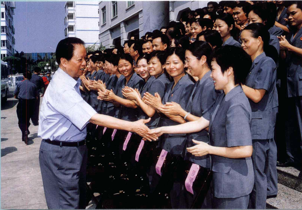
2002年5月28日，中国首席大法官、最高人民法院院长肖扬视察北海，亲切接见全市两级法院干警