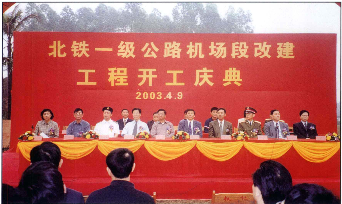
2003年4月9日，北铁一级公路机场段改建开工庆典