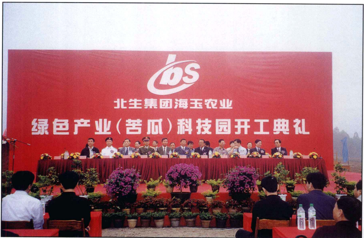
北生集团海玉农业绿色产业(苦瓜)科技园开工典礼