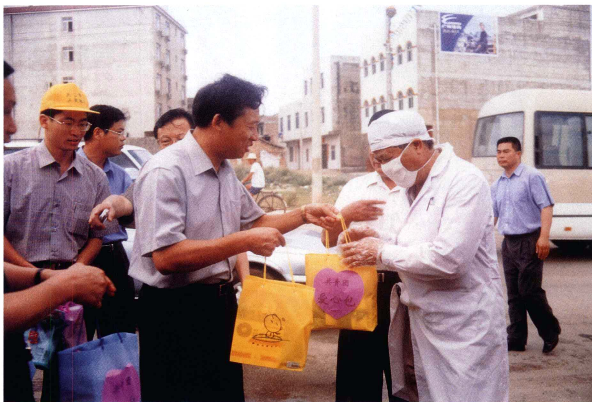
市长刘君慰问防非典一线的医护人员