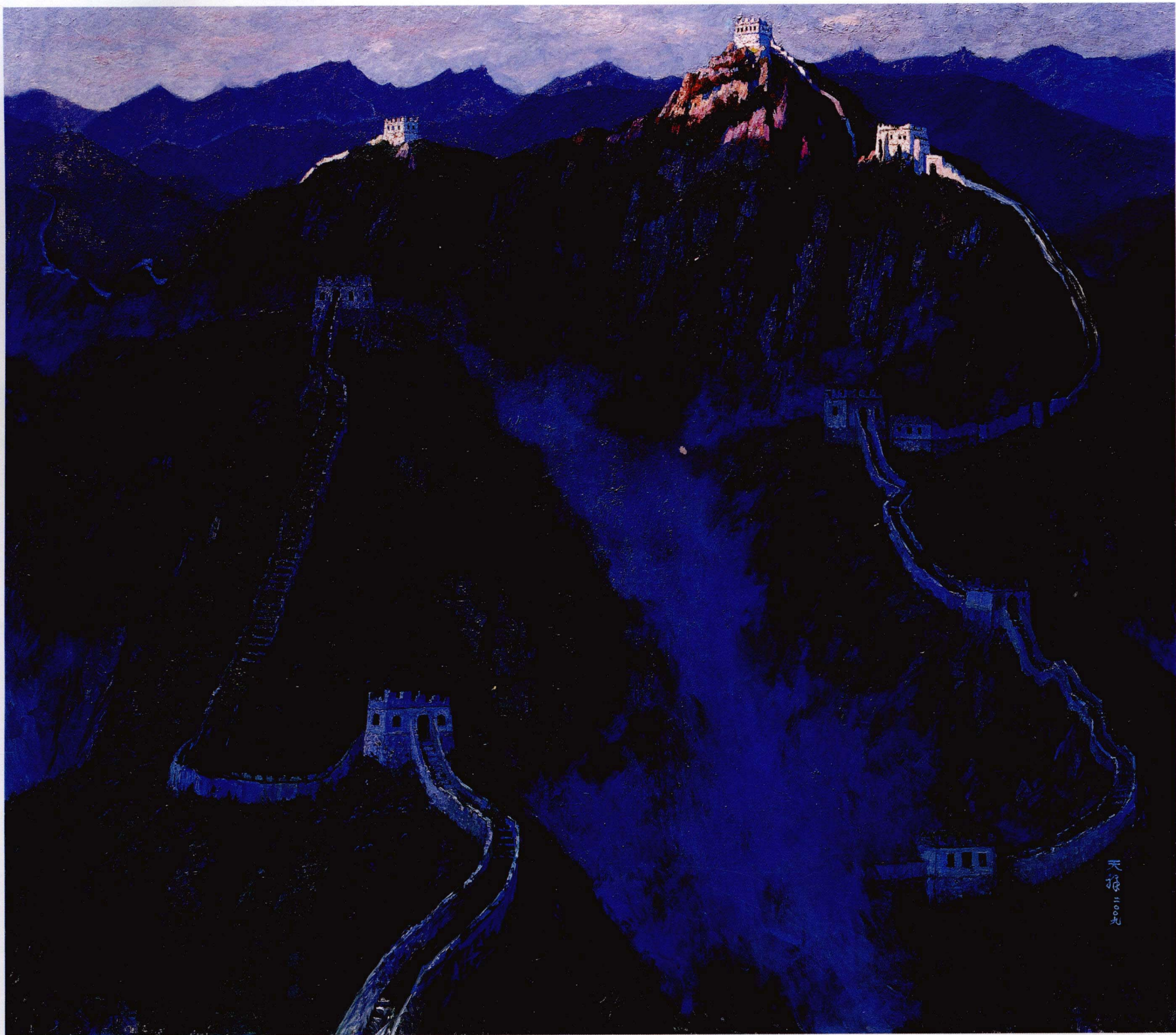
东方破晓 240cm x 200cm 李天祥