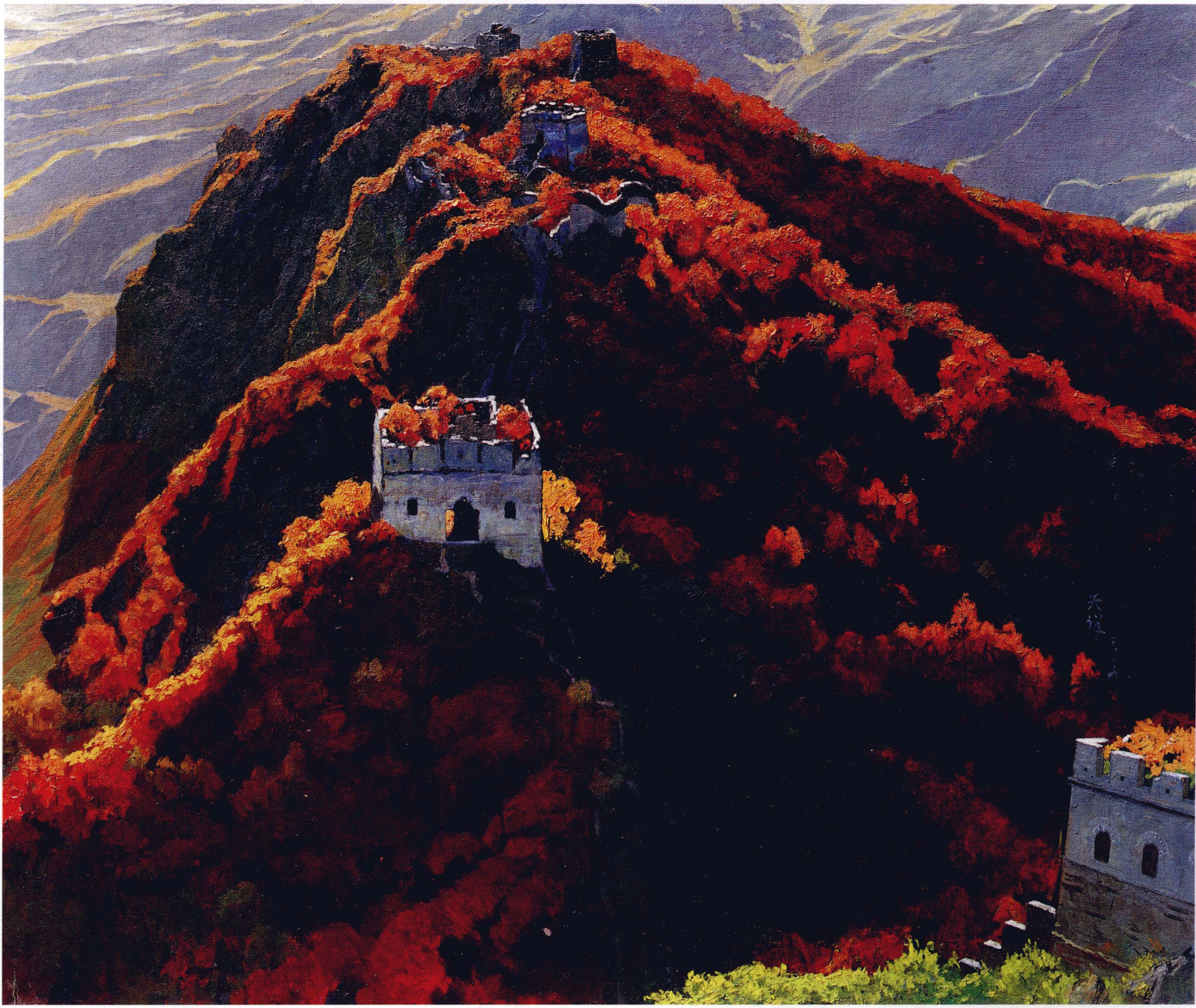
漫山红遍 180cm x 150cm 李天祥