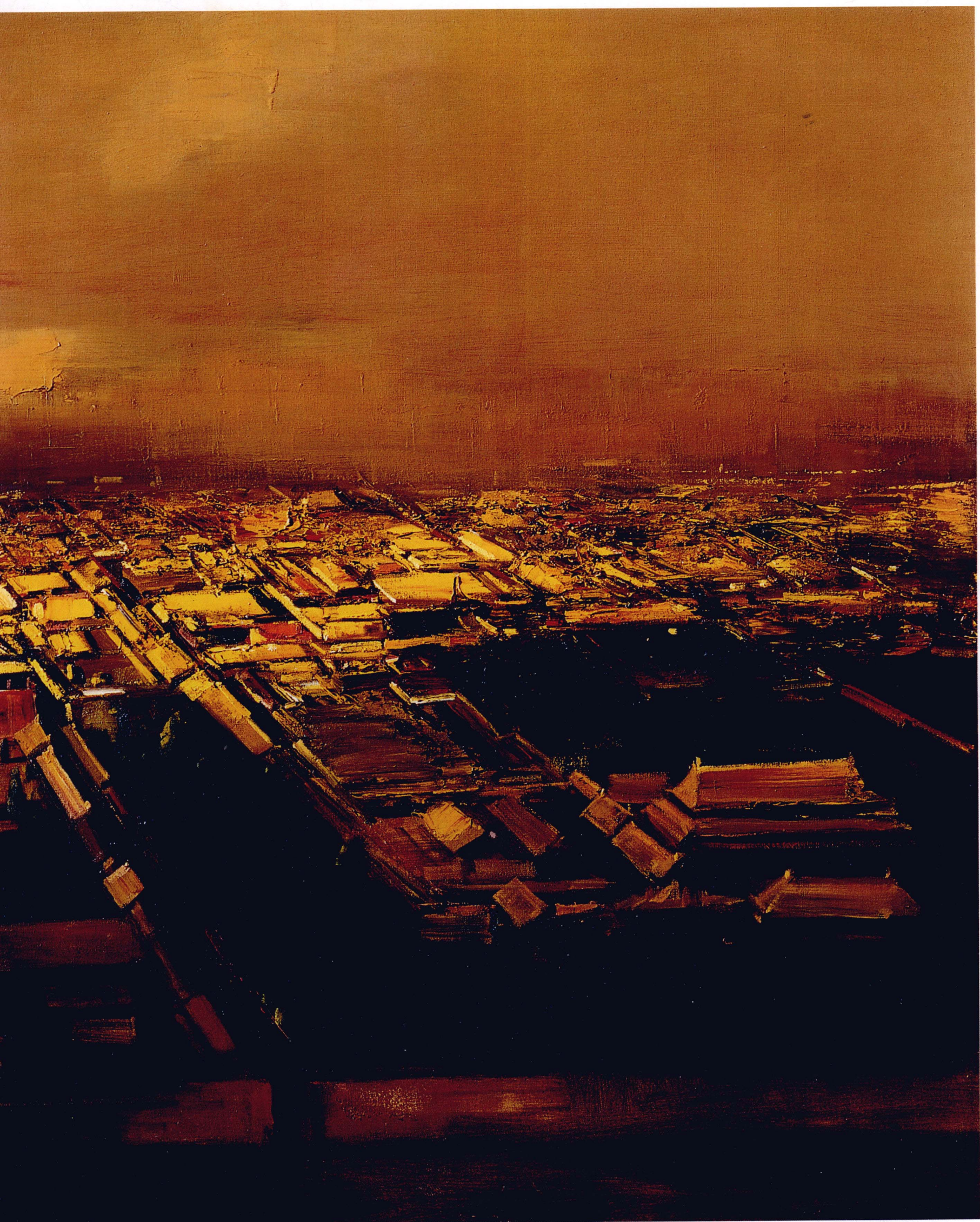
紫禁城的黄昏 200cm x 120cm 白羽平