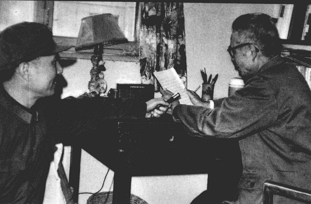
▼ 1977年，国际台的工作人员在协助黄维将军进行对台广播