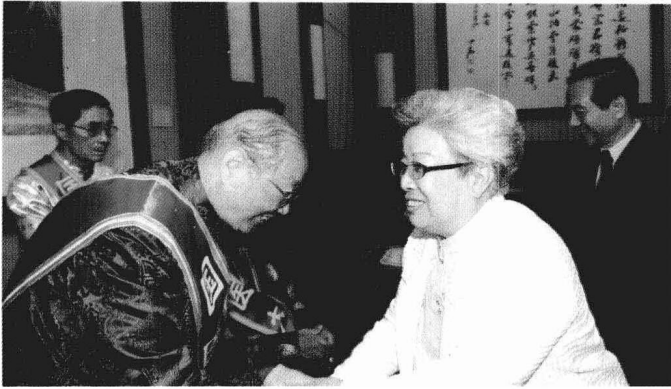
◀ 2009年6月19日， 原国务院副总理吴 仪同志亲切会见国 医大师朱良春教授

2008年10月18日， 中国中西医结合学 会风湿病专业委员 会在人民大会堂授 予朱老“推动风湿 病学术发展特殊贡 献奖”。会前，国家中 医药管理局吴刚副 局长亲切会见朱老 ▶