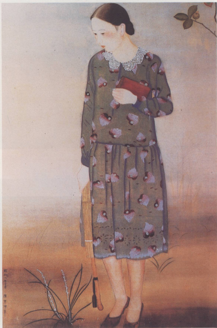
無題 國畫 1932 4.6×2.7尺。