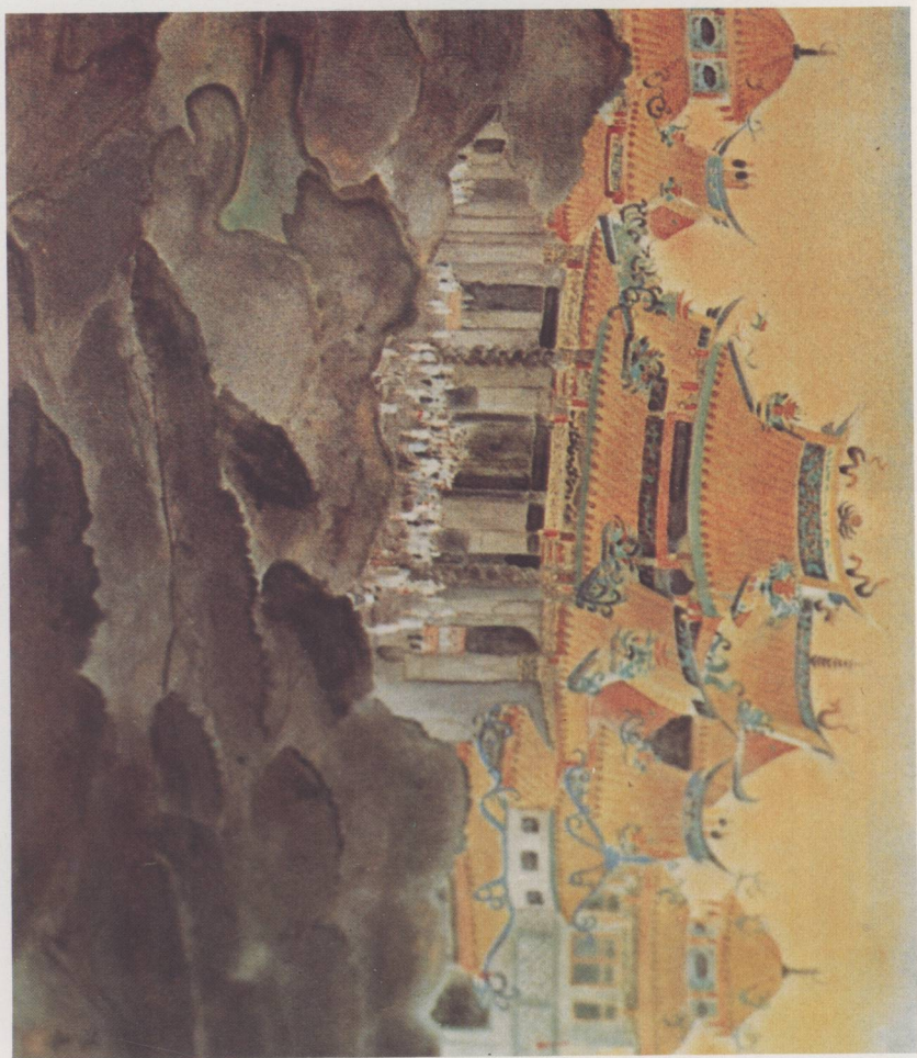
陳進 廟會 膠彩