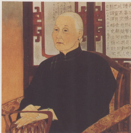
臺陽美術協會成員之一陳進女士作品《萱堂》，國畫 1947 45×50 cm。