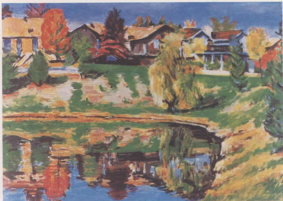
池畔 油畫 1990 20 F (陳慧坤提供)。