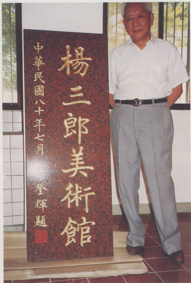
中華民國第一座私人美術館興建，開啓了藝術個人典藏之先風，也爲藝術家的理想提昇了更高層次的錘鍊（王保雲攝 1991,07）。