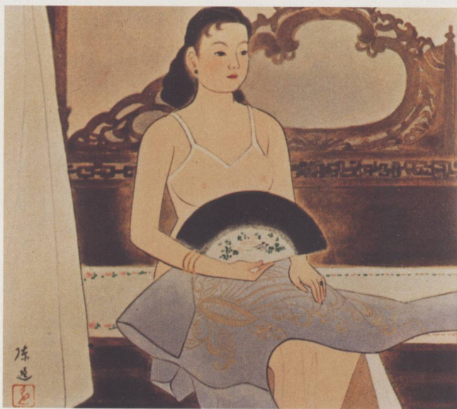
陳進 洞房 膠彩 1955