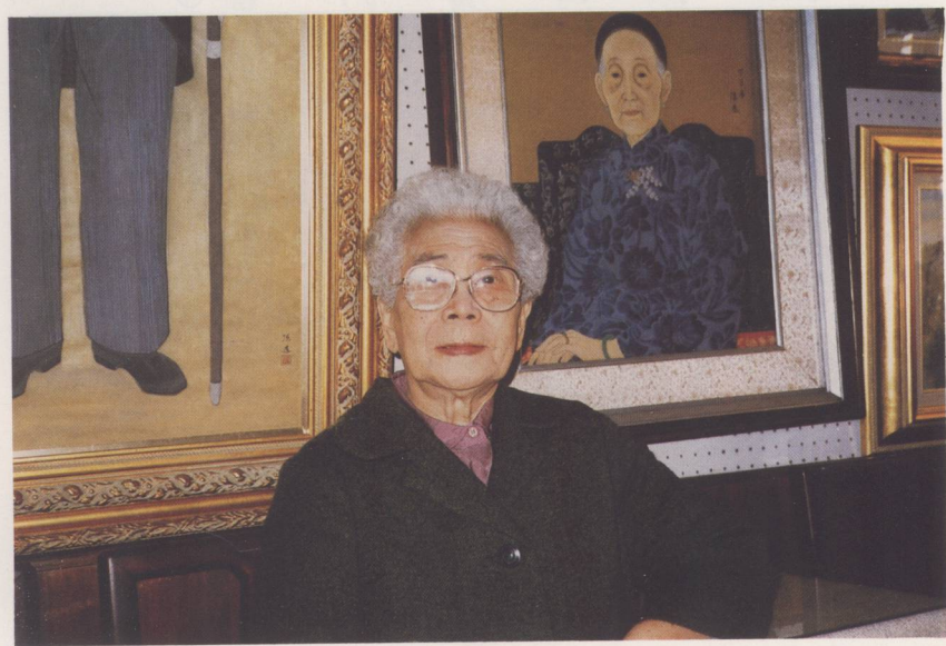
臺灣前輩女畫家陳進