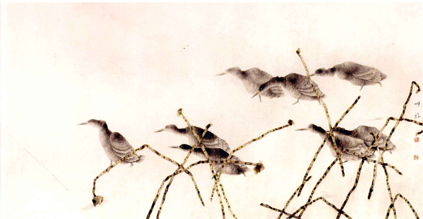
冬塘 195 × 95CM