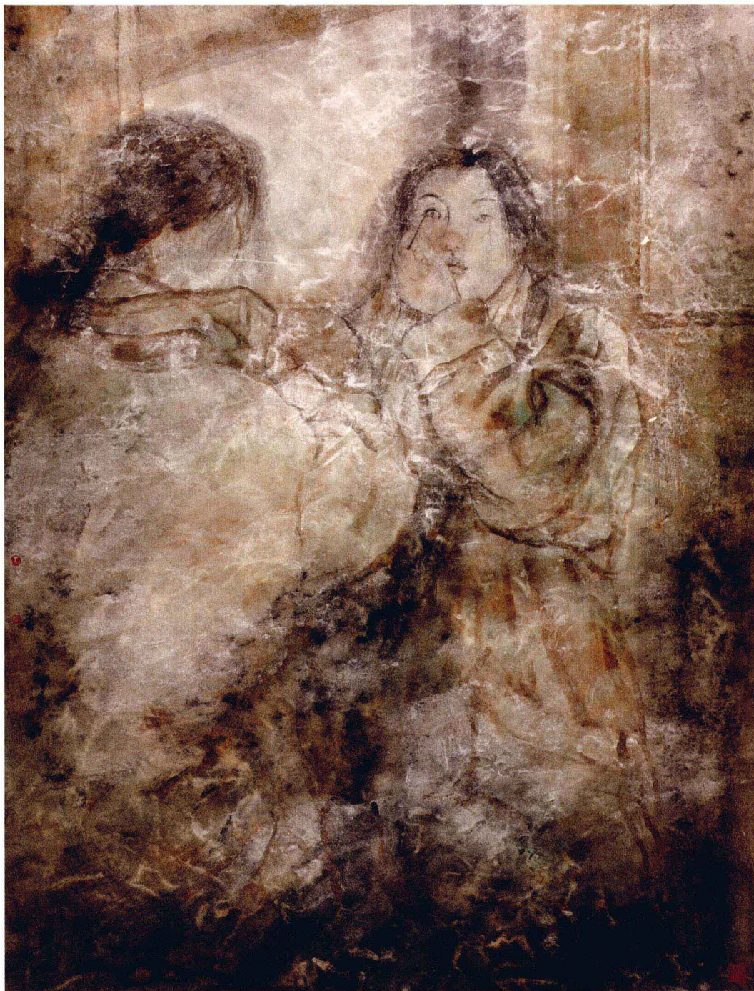
空镜子 95 × 135CM