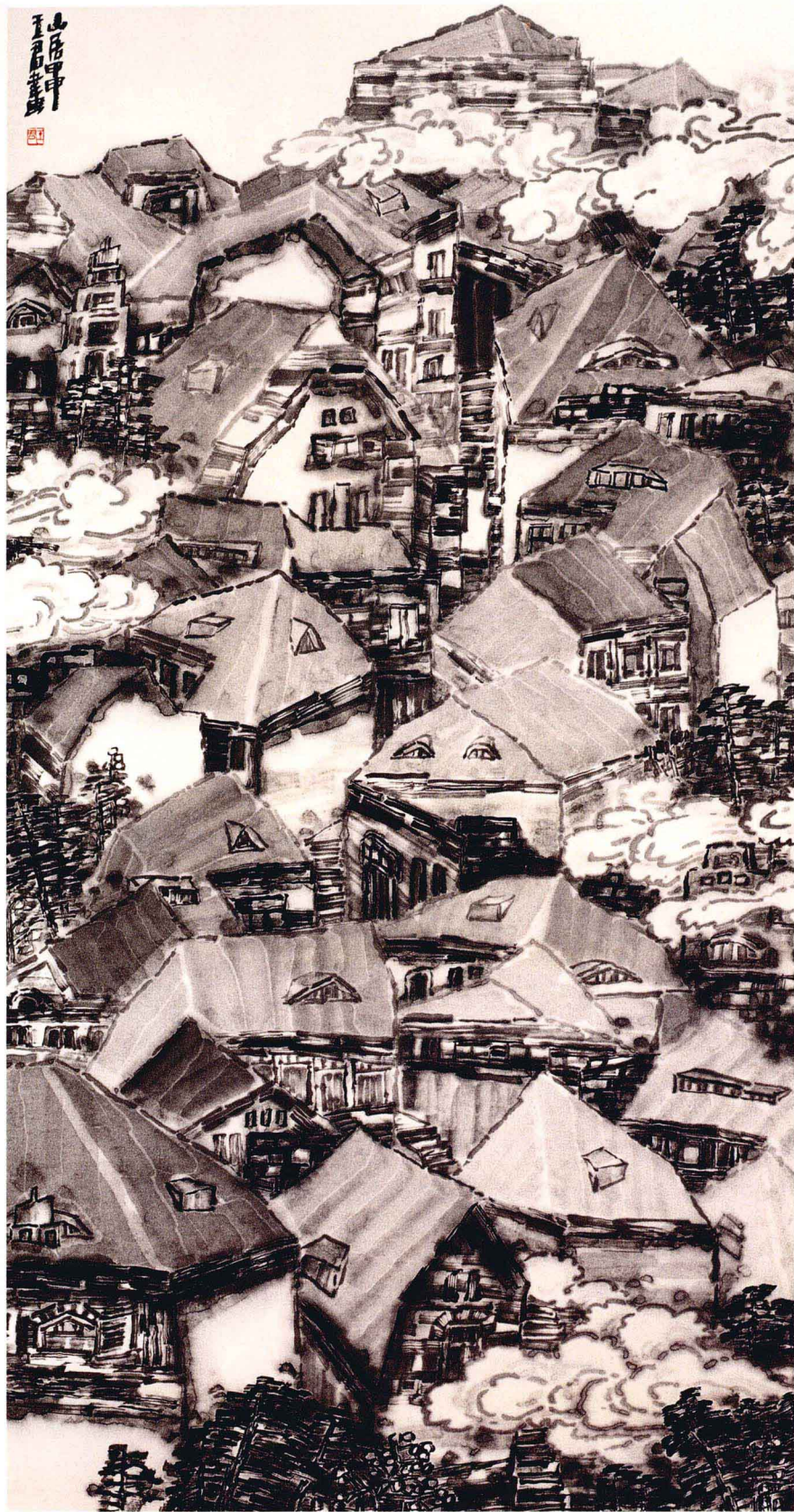
山居 95 × 178CM