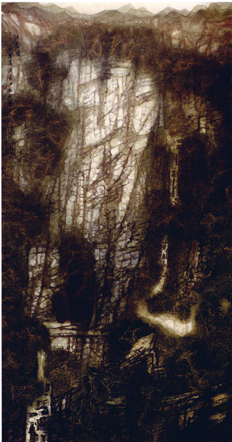
沐春图 95 × 195CM