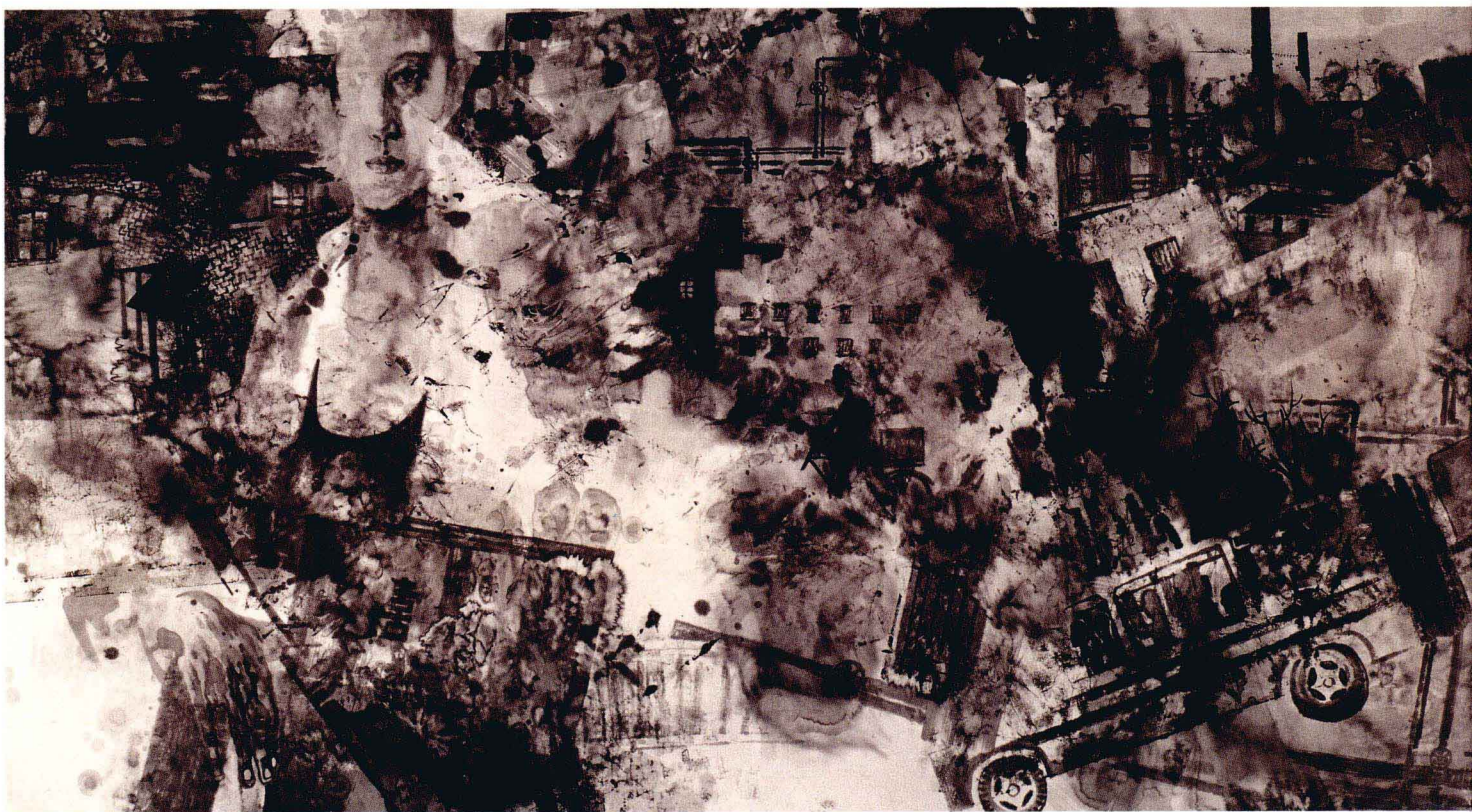
八十年代 180 × 95CM