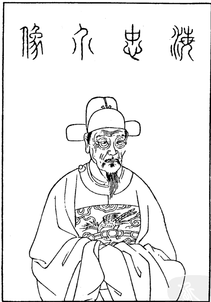
海 瑞 像 (據吳郡名賢圖傳贊)