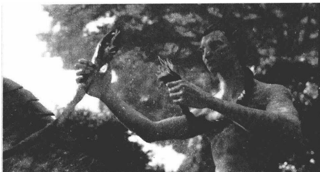
图 1-3 电影《阿凡达》

同时，电影中的“经典台词”和主题曲，用纳美人土著语说的“I See You”，意味着不仅是表面上的视觉效果，还有能看到并理解内心的意思。物联网也是这样，将来到商店去买一包巧克力，你将不仅看见它表面的样子，还可以通过内置的射频识别（RFID，Radio Frequency Identification）芯片来了解它的各种信息，好像是“巧克力的内心”，而周边商场同类巧克力的价格以及你购买了这块巧克力的信息，也都可以在物联网中被存储、被调用。因此，有人将《阿凡达》称为史上最强的物联网宣传片。