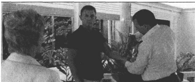
图 1-1 电影《大战皇家赌场》

钻的大家伙在邦德的手臂中植入了一枚电子芯片，并通过扫描设备将身份的信息植入芯片，如图 1-1 所示。此时，邦德对 M 夫人说：“八婆，你想监视我？”M 夫人不动声色地说：“是的。”但正是这枚能够识别个人身份信息的芯片，关键时刻成为邦德的救命恩人。勒·希弗斯为了除掉邦德，在他的酒里下毒。当邦德历尽千辛万苦钻到车内，并使用扫描设备激活电子芯片后，一条求助消息发送到总部的信息系统中。在总部专家的远程指导和芙斯珀的大力协助下，邦德转危为安，从昏迷症状中恢复过来，成功赢得了最终的赌局。最后，邦德用枪指着坏蛋怀特的头，说出那句标志性台词：“The name's Bond, James Bond”。