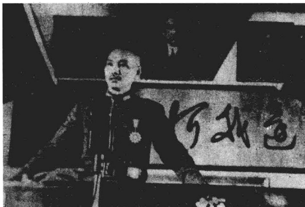
蒋介石发表抗战演讲

蒋介石看了密报心里有数,但没有由头也不便处理丁默邨。就在3月29日到4月6日的国民党五届四中全会上,通过了大力扩充特务组织的