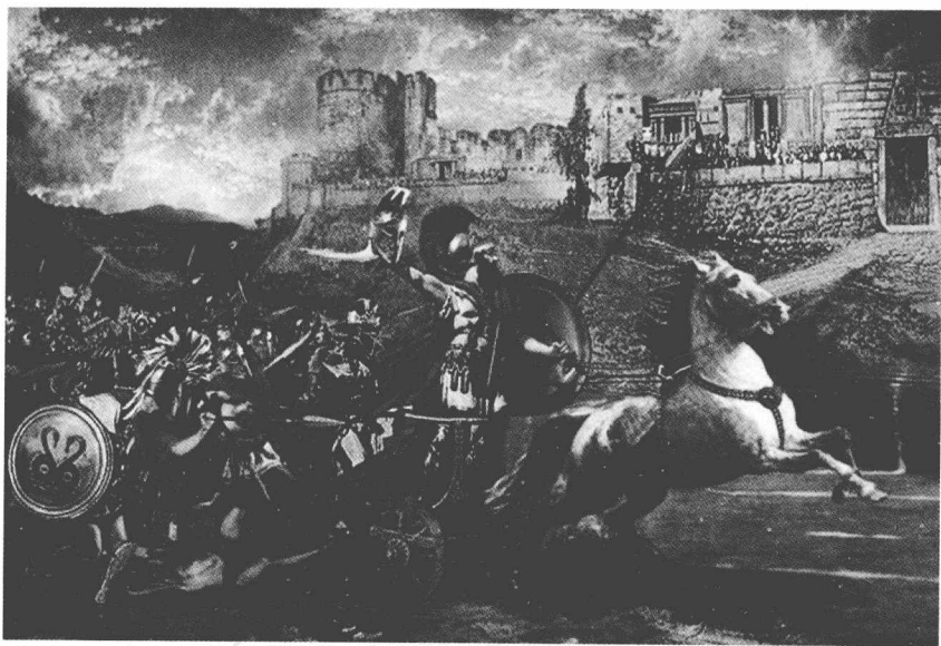
→ 战车上的阿喀琉斯

城，打了十年，久攻不下。但他们攻占劫掠了一些与特洛伊联盟的小亚细亚沿海城邦，掠得了一些女奴和财物，分给了各位将领。阿伽门农分得了阿波罗神庙祭司克律塞斯的女儿——美丽的克律塞伊斯，留在自己帐中。克律塞斯带着金银财宝来到希腊军营盘，希望赎回女儿。但阿伽门农不愿失去他的美女，拒绝了老人的请求，并喝令他赶快滚开。克律塞斯没赎回女儿反受了辱骂，回去向他所祭祀的太阳神阿波罗祈祷，请求向希腊人报复。太阳神听了他的祭司的祈祷，很生气，便向希腊营盘发出了数不清的神箭，使大量的希腊人中疫病而死亡。