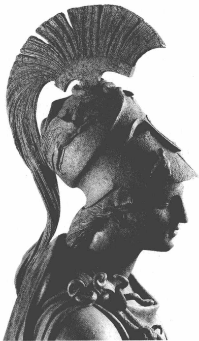
→ 智慧与战争女神雅典娜

说阿喀琉斯放弃个人意气，出去作战，但阿喀琉斯不肯。到了这生死存亡的时刻，阿喀琉斯同意帕特洛克罗斯穿上他的铠甲，出去吓退特洛伊人。特洛伊人一见穿着阿喀琉斯铠甲的帕特洛克罗斯，以为阿喀琉斯与阿伽门农和好了，又投入战斗了，不战自溃，阵线动摇，纷纷逃避。一直退到城门边，他们才发现追杀过来的不是阿喀琉斯本人。赫克托耳回过头来迎战帕特洛克罗斯，经过一番恶斗，帕特洛克罗斯终究不是赫克托耳的对手，被赫克托耳杀死了。阿喀琉斯的那套铠甲，也被赫克托耳夺去了。