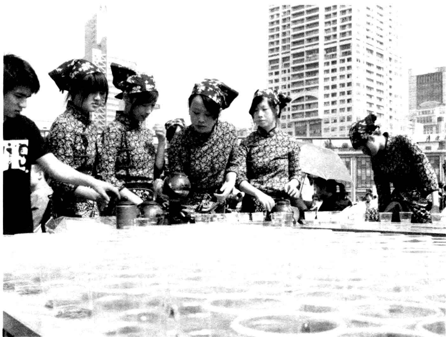
宁波名茶在天一广场向社会展示一角

为使茶文化和宁波名茶进一步走向社会深入到市民中去，在茶文化赠书仪式上，《宁波八大名茶》一书首发，向八大名茶企业代表和社会赠送《宁波八大名茶》书籍；并向第二批宁波市少儿茶艺教育实验学校赠送《中华茶文化少儿读本》，为方便市民用茶，又由清源茶馆开设宁波名茶专卖店松沅茶行并举行授牌仪式。