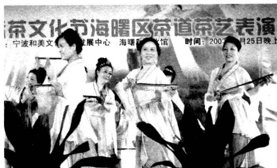
老年茶艺表演队引人注目

市民踊跃参加本届茶文化节。天一广场有茶道茶艺表演、无我茶会；茶道茶艺进了社区，社区居民积极参加茶文化知识竞赛，茶谜语竞猜等活动，还办有茶文化书画作品展，为茶文化节增添了欢庆气氛。