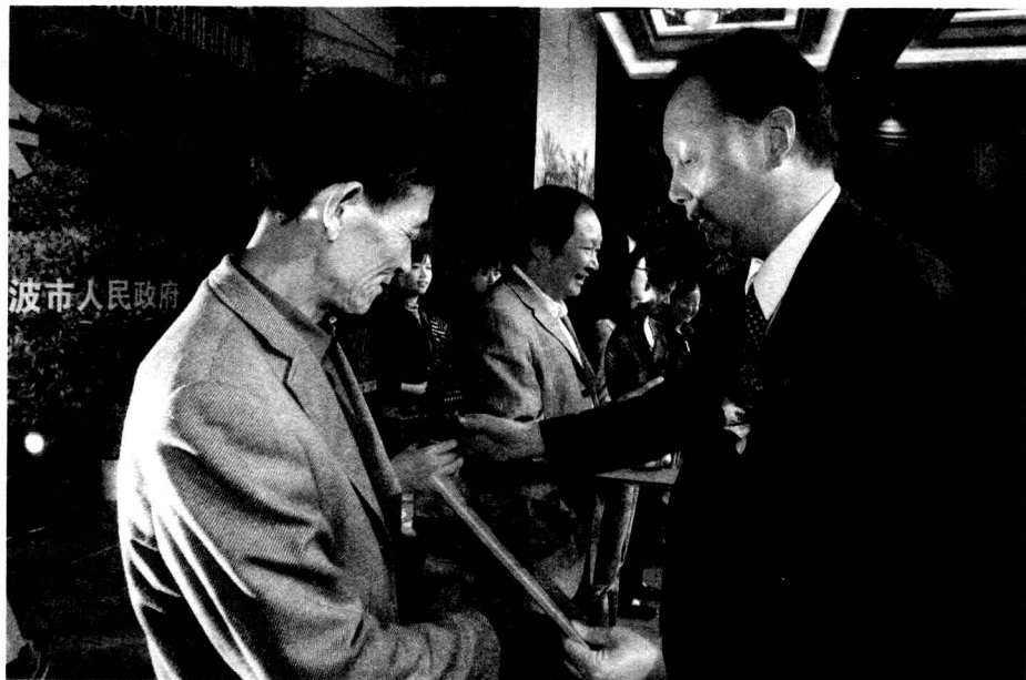
副省长茅临生为荣获中绿杯金奖的茶企业代表颁奖