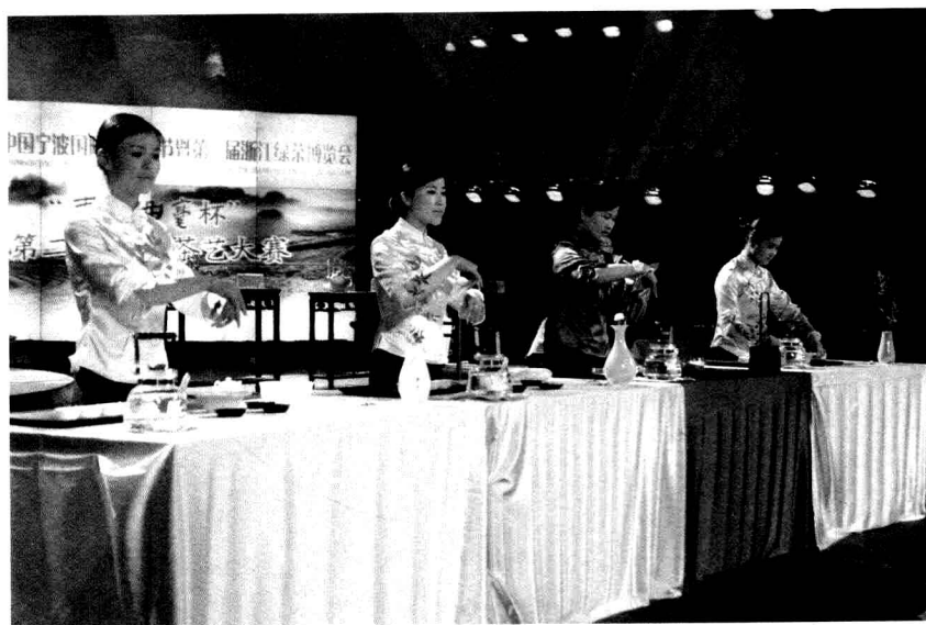
各茶艺队竞技镜头