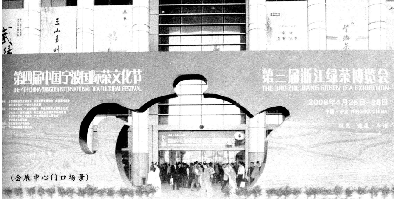
(会展中心门口场景)

第四届中国宁波国际茶文化节暨第三届浙江省名优绿茶博览会4月25日至28日在宁波国际会展中心举行。本届茶文化节以“绿色、健康、和谐”为主题，围绕展示展销、商贸洽谈、茶艺文化、评优评奖、专家论坛等五大系列活动展开。汇集了浙江、福建、云南、贵州、四川、重庆、湖北、安徽、江西、广西、江苏等省市名优绿茶，参与全国名优绿茶“中绿杯”评奖，为历届规模最大、展位最多的一次节会。