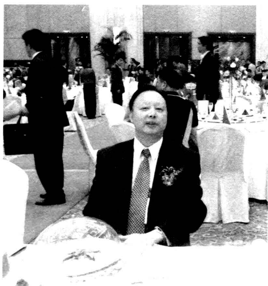
浙江省人民政府副省长茅临生在开幕招待会上