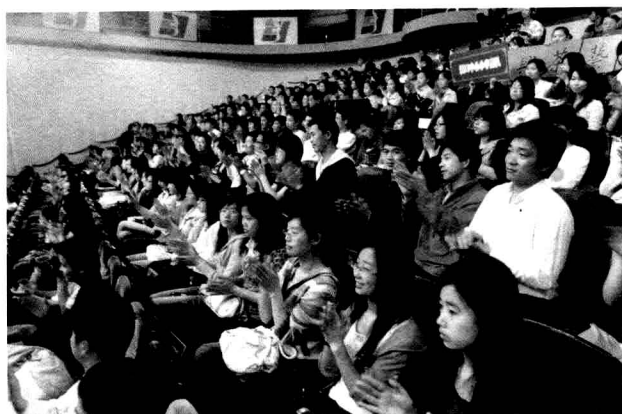
众人关注茶艺大赛

第二届宁波茶艺大赛在今年茶文化节期间举行。由本市街道、社区、学校、茶馆和茶楼等单位选送的23支队伍，经过自选和茶艺技巧比拼、茶道茶艺专业知识问答、品茶知识和茶艺技巧的展示三轮综合打分，鼎新茶文化会所、溪口真中心小学少儿茶艺队等6支队伍分获一、二、三等奖。