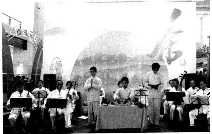
展示会上的茶艺表演

在宁波国际会展中心有来自全国各地的300多家茶业及相关企业参与展出，展会面积达9千平方米。3天内参观人数达4万余人次，现金交易人民币2000万元。