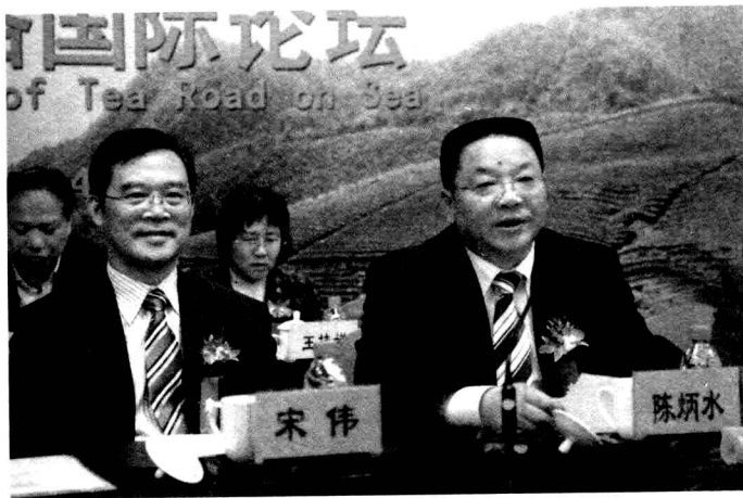
中共宁波市委常委、宣传部部长宋伟（前排左一）和宁波市人民政府副市长陈炳水（前排左二）在宁波东亚茶文化研究中心授牌仪式暨海上茶路国际论坛上

本届茶文化节举办了两大论坛，茶业战略论坛发表了宁波茶叶宣言；宁波东亚茶文化研究中心授牌仪式暨海上茶路国际论坛，来自日本、韩国，马来西亚、香港、澳门及国内外各地的专家相聚一堂，对海上茶路与东亚茶文化作了专题研讨。