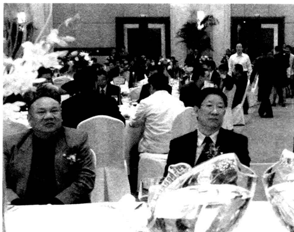
浙江省人大常委会副主任程渭山（左一）和宁波市政协主席王卓辉（左二）在开幕招待会上

自2004年开始举办中国宁波国际茶文化节以来，历届茶文化节得到各级党委和政府的重视和支持，也受到省内外各界著名人士的热切关注。陈炳水副市长主持本届开幕招待会时，对各位领导和嘉宾莅临茶文化活动致以衷心感谢。