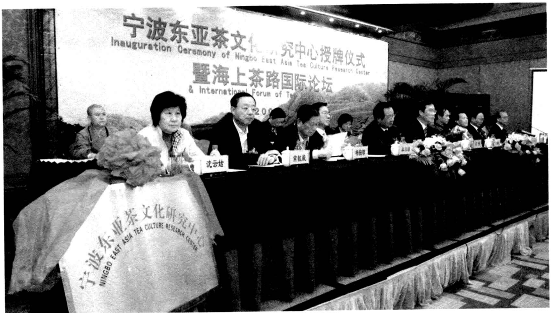
出席宁波东亚茶文化研究中心授牌仪式的宁波市领导与外地贵宾在主席台上

本届茶文化节举办了两大论坛，茶业战略论坛发表了宁波茶叶宣言；宁波东亚茶文化研究中心授牌仪式暨海上茶路国际论坛，来自日本、韩国，马来西亚、香港、澳门及国内外各地的专家相聚一堂，对海上茶路与东亚茶文化作了专题研讨。