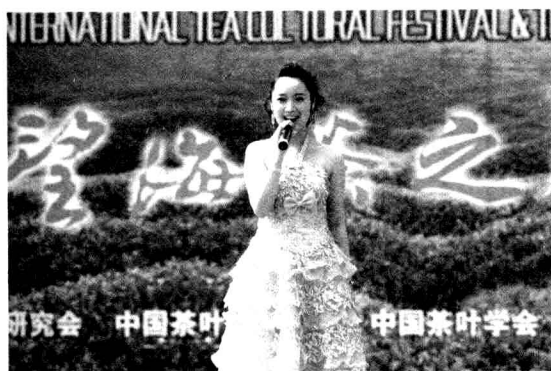
茶艺表演节目之一