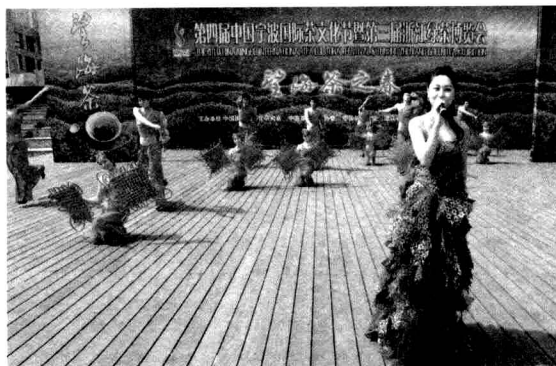
茶艺表演节目之二