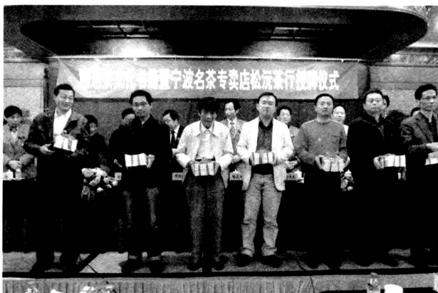
向名茶企业代表赠送《宁波八大名茶》书籍