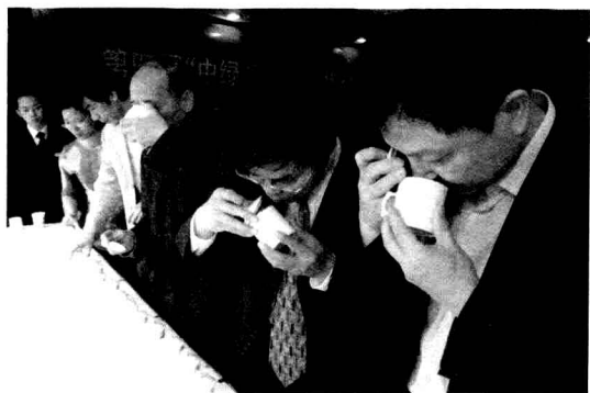
专家评奖中绿杯现场

本届茶文化节期间，举办了第四届全国中绿杯名优绿茶评奖。评比活动由中国茶叶流通协会任主任单位，与中国国际茶文化研究会、中国茶叶学会等单位共同举办。浙江、江苏、安徽、福建、云南、贵州、四川、重庆、湖北、江西、广西等省（市）送达参赛茶样314个。经来自全国各地的9名专家认真细致、公平公正的评审，评出金奖70个、银奖71个、优质奖51个。