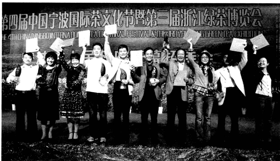
荣获金奖单位的代表在授奖台上