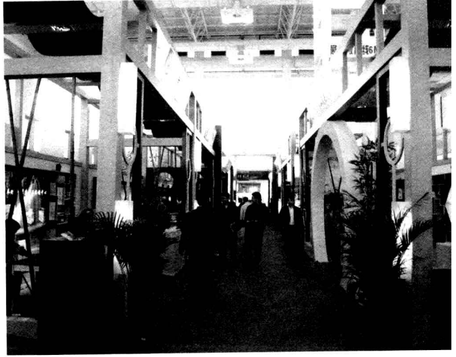
宁波市供销社组织的展销摊位