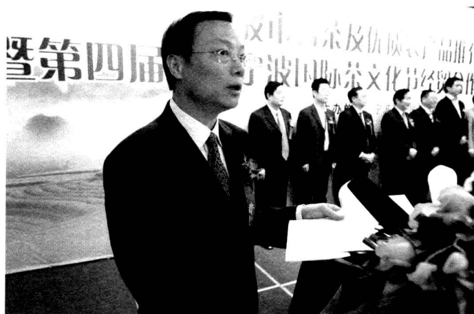
中共宁波市委副书记、市农办主任戴国华同志主持签约项目仪式

茶文化节以茶会友，项目签约热火。在名茶及优质农产品推介会上，14个农业投资、农业贸易项目在会上签约。总成交额折合人民币3.1亿元。其中贸易项目成交0.4亿元，投资项目成交2.7亿元。本届茶文化节还举办了名茶拍卖会。