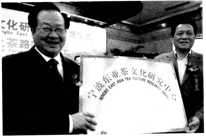
浙江省政协原副主席张蔚文向宁波东亚茶文化研究中心主任徐杏先授牌