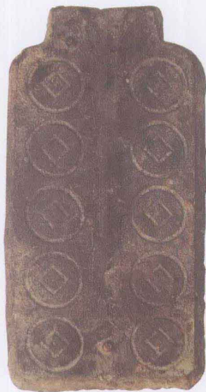
新莽“大泉五十”钱范

入，钱币收藏的类型与研究的对象也都有不断扩大的迹象。除了历代铜质铸币继续是人们关注的对象外，实物货币（海贝、石贝、骨贝、玉贝、铜贝），称量货币（青铜、金银），各类金属铸币（铜、铁、铅、锡），近代机制币（金币、银币、铜币、镍币、铝币），古钞及铜板，近现代纸币（包括各种票证），近现代金银纪念币，历代浇铸钱币的钱范，称量贵金属铸币的砝码，民俗钱以及各类古今外国钱币，都可成为钱币收藏、鉴赏和研究的对象。一般来说，可根据个人的兴趣爱好、知识层次、经济实力等方面因素来确定。