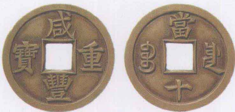
▲ 咸丰重宝（当十铜质雕母）