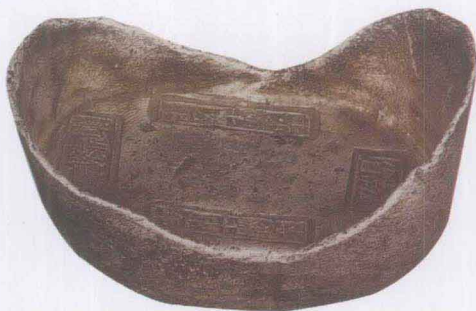
清 光绪湖南傅聚顺五十两银锭

1938年丁福保编印出版的《古钱大辞典》，集中展示了第二次钱币收藏热潮中搜集、收藏及研究的成果。《古钱大辞