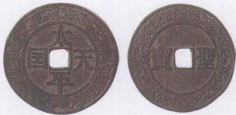
▲ 清末 太平天国 圣宝（双龙戏珠小花钱）

“孔方兄”是方孔圆钱最有名的一个别称。最早源于东晋南阳人鲁褒。他在《钱神论》中说“钱之为体，有乾有坤，内则其方，外则其圆，亲之如兄，字曰孔方……”。由于“孔方兄”这个称呼既形象又风趣，所以一直流传下来。带有一丝对金钱的轻蔑和无奈。