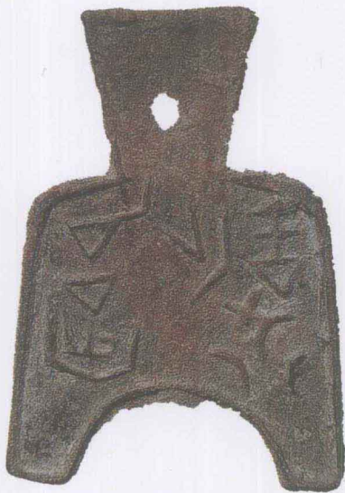
春秋战国“安邑半金”布币

早在南北朝时期，我国就有学者从事钱币的研究，南朝顾烜的《钱谱》是最早见于史籍的钱币著作，同时期还有刘潜的《泉图记》、顾协的《钱谱》。遗憾的是这三部处于古代钱币学开创阶段的著作，没有流传下来，我们只能从后人的记述中略知一二。