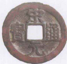
▲ 北宋 宋元通宝

称钱为“阿堵物”，也是一个自命清高的人的创举。西晋时的王衍清高孤傲，无论何种场合，绝口不提“钱”字。其妻想试探一下王衍的清高程度，就趁其熟睡之时，在他的床边铺上一大圈钱。王衍醒来后觉得钱妨碍他行动。便叫来仆人说“举却阿堵物”。“阿堵”是当时的常用语，相当于现代汉语的“这个”。