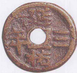
元 “延祐三年” 供养钱

典》分为总论、上编、下编三部。上编是古钱图，广收上自先秦刀币下至清末圆钱以及压胜钱、马钱的原来拓本；下编为辞典，按古币名称的笔划为序排列集录了前人对该种古钱的考订文字。全书资料丰富，条目繁多，是我国第一部综合性的钱币工具书，在我国钱币学发展史上具有重要意义。