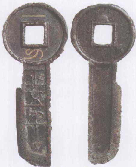
⬆ 新莽 一刀平五千

所谓“讖纬”，就是对汉字和图形进行符合自己利益的解释，充满了荒诞、迷信的色彩。两汉时期讖纬之说大行其道，从而给“金错刀”和“货泉”这两种普通的钱币涂上了神秘的色彩，汉王朝的命运也因此发生了天翻地覆的变化。