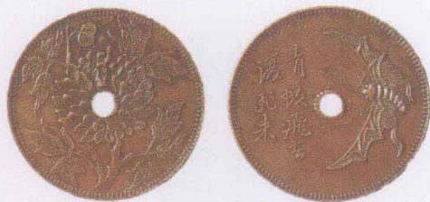
⬆ 民国 成都造币厂“青蚨飞去又飞来”铜圆样币

远，也会很快知道并立即飞来找到虫卵并带走。人们利用青蚨的这一特性，将子青蚨的血涂在钱上，购物付款时，用子钱，用掉的钱都会再飞回来。这样循环往复，钱就永远都用不完了。