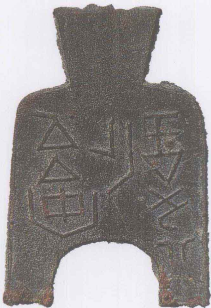
春秋战国“安邑半金”布币

中国钱币文化内涵丰富，源远流长，是中华民族历史文化的—个重要“宝藏”。从古到今，有很多学者和收藏家对这一“宝藏”进行过研究和考证，留下了大量钱币学著作，成为我们今天收藏、鉴赏钱币的重要参考文献。除此之外，历朝历代的典章制度、奏章廷议等档案文献，文人墨客的题咏、绘画和文学作品等，有的也反映了钱币的形制、文字、图案、制作、币材、轻重、色泽、成分等基本情况，值得钱币收藏爱好者关注。