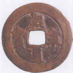
北宋 熙宁通宝（铁母）

入，钱币收藏的类型与研究的对象也都有不断扩大的迹象。除了历代铜质铸币继续是人们关注的对象外，实物货币（海贝、石贝、骨贝、玉贝、铜贝），称量货币（青铜、金银），各类金属铸币（铜、铁、铅、锡），近代机制币（金币、银币、铜币、镍币、铝币），古钞及铜板，近现代纸币（包括各种票证），近现代金银纪念币，历代浇铸钱币的钱范，称量贵金属铸币的砝码，民俗钱以及各类古今外国钱币，都可成为钱币收藏、鉴赏和研究的对象。一般来说，可根据个人的兴趣爱好、知识层次、经济实力等方面因素来确定。