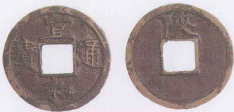
▲ 北宋 宣和通宝（背文“陕”）

古代一些文人自命清高，耻于谈钱，将流通于市场上的钱币雅称为“泉”，意喻“清泉水流，源源不断”。后来国家的铸币场所也称为“宝泉局”、“宝源局”等。今天在收藏领域，人们还是称古钱币为“古泉”，称收藏钱币者为“泉友”。