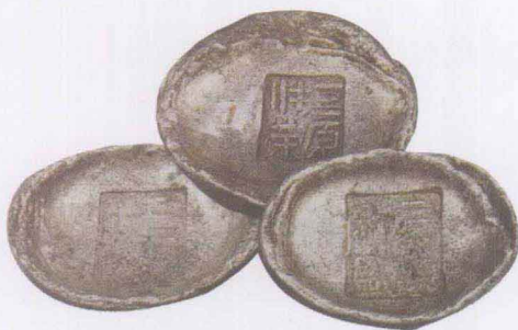
清 陕西三原和盛三两银锭

钱币学研究图录和论著也层出不穷，钱币学研究进入空前繁荣的阶段。据统计，至今为止钱币专业领域正式与非正式的刊物已不下50余种，出版的钱币专业图书数以百部。这些成果得益于大量钱币文物，也借助了各种现代科学技术手段。到了20世纪90年代初，钱币学研究领域进一步拓宽，突破了传统“谱学”、“史学”的封闭式研究，除了注重研究钱币器物本身外，还向钱币制度、钱币文化等方面拓展。