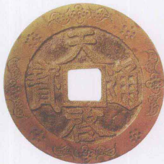
明天启通宝（刻花钱）

铁等金属铸币以及五光十色的纸币。其中铜质铸币，是中国古代钱币的主流。铜质铸币的形制，除了先秦时期的刀、布、蚁鼻钱（仿贝）、圜钱，以及两汉之间新莽的异型币外，主要为方孔圆钱。中国古代金属铸币，历经千年百代王朝兴废的风雨洗礼，在中国历史上留下了灿烂的钱币文化，是中华民族文化遗产的重要组成部分。通过古钱币，可以认识中国历史的政治、经济和文化面貌，所以历来受到收藏者的重视。