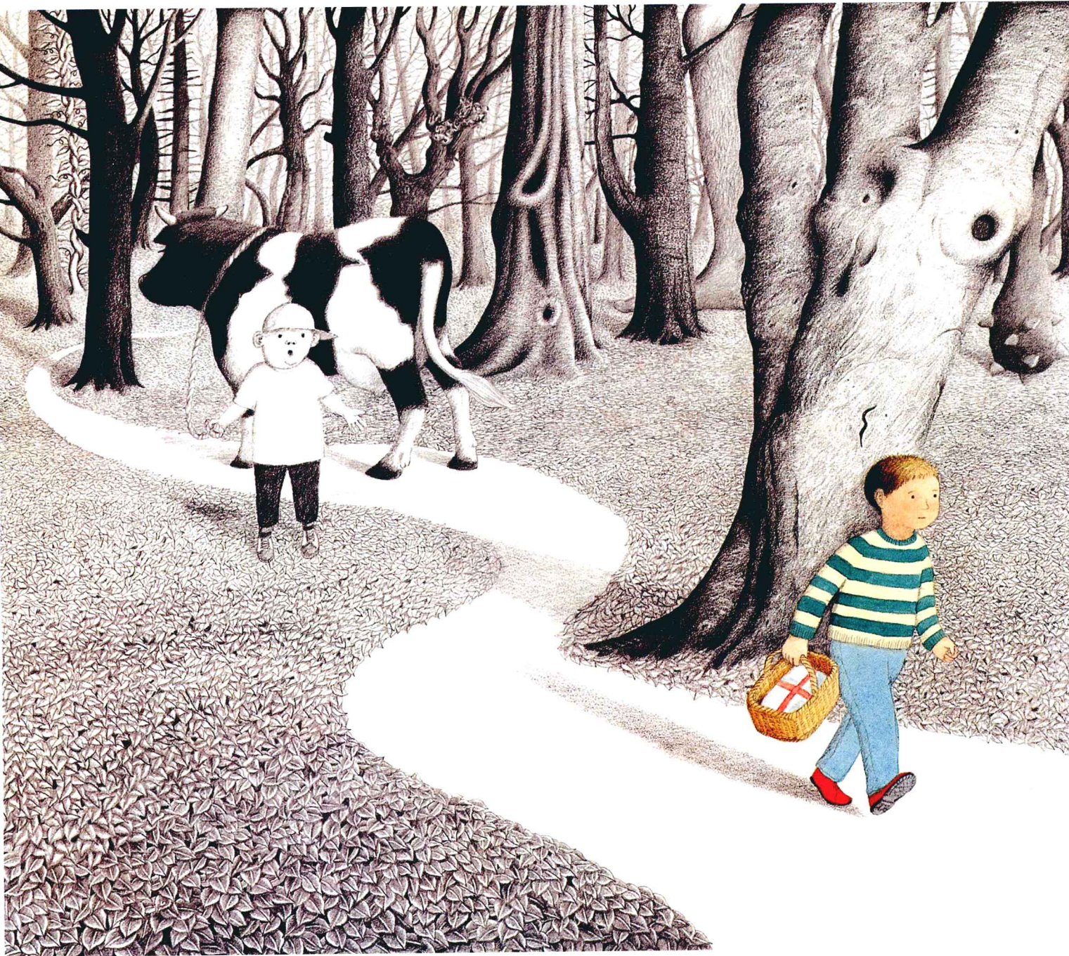
走进大森林 作者：安东尼·布朗