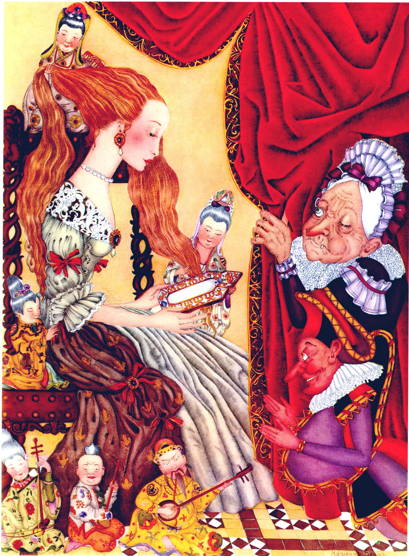
绿蛇 作者：阿德里安·塞古尔