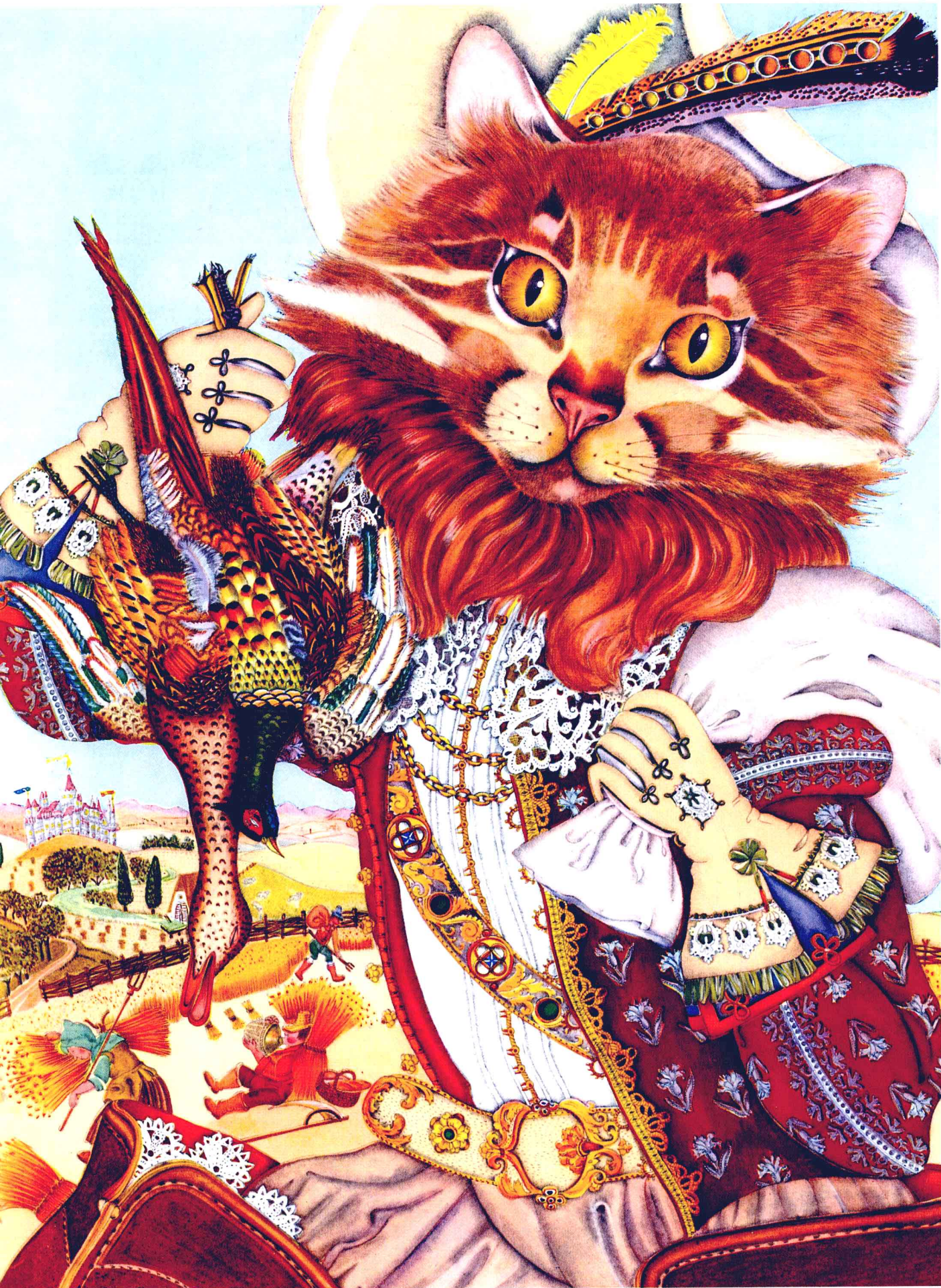
穿靴子的猫 作者：阿德里安·塞古尔