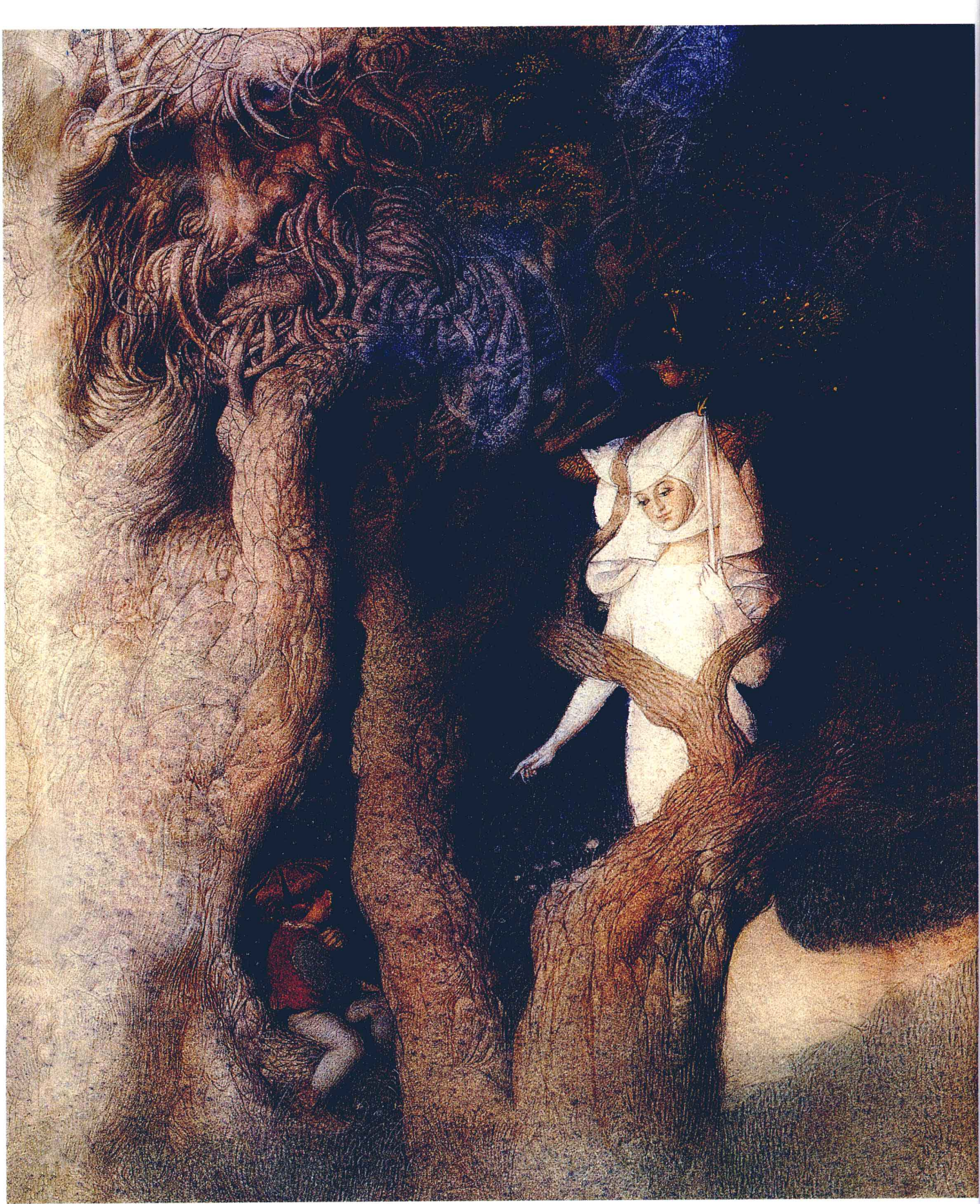
杰克和豆藤 作者：肯尼迪·斯派恩