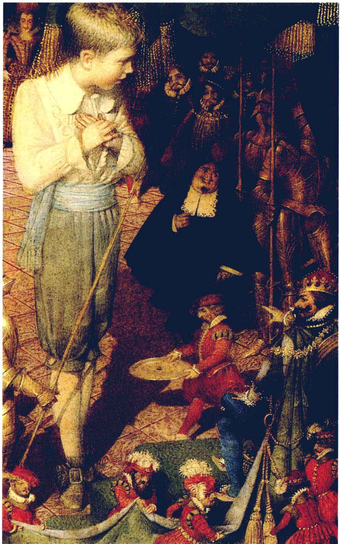
黑色的小母鸡 作者：肯尼迪·斯派恩