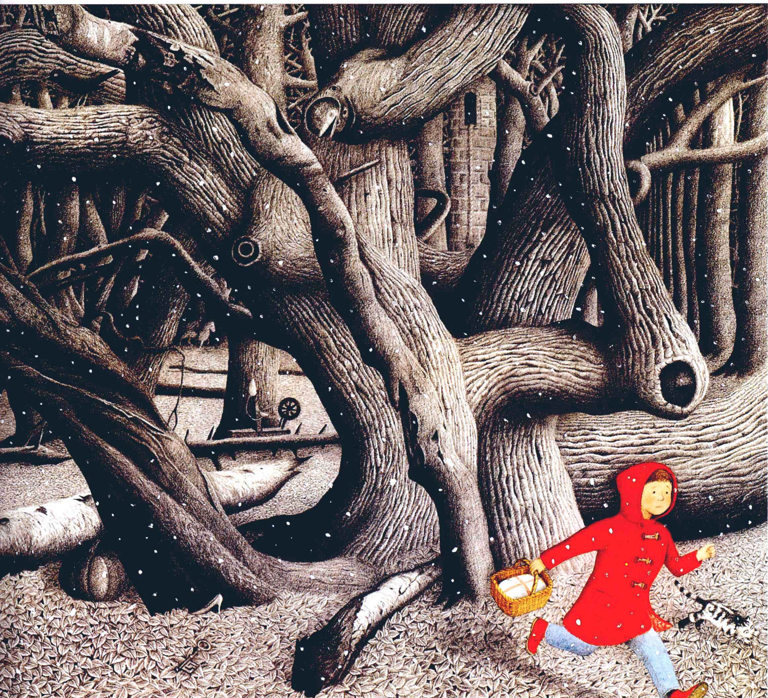
走进大森林 作者：安东尼·布朗