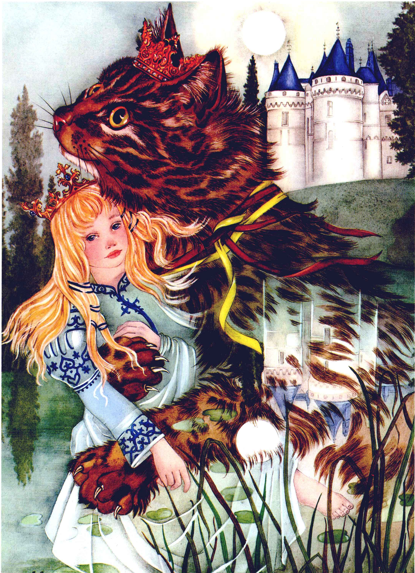
中魔法的猫奇普 作者：阿德里安·塞古尔