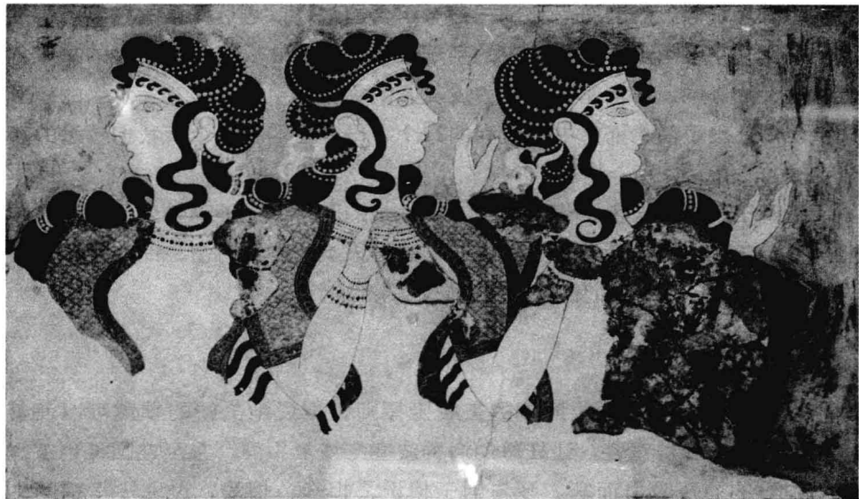
克诺索斯皇宫内的壁画

字……约公元前1400年左右，可能由于敌人的入侵或者自然界的灾害，克里特文明开始迅速衰弱，后来竟无声无息地消失了，以至于后世人们对克里特文明是否存在过产生了怀疑，直至米诺斯王宫被考古学者发现。