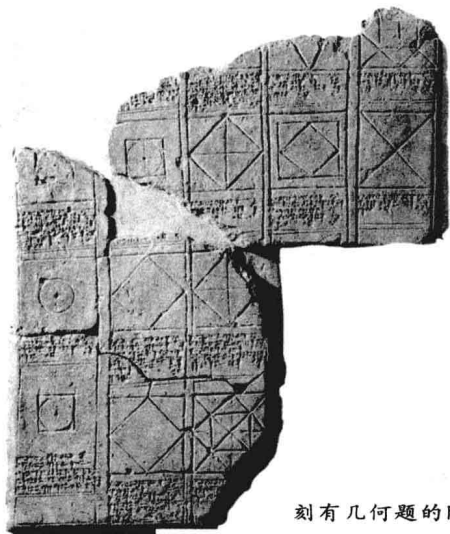
刻有几何题的阿卡德楔形文字泥板

角形尖头的芦苇秆（或木棒、骨棒）当笔刻在泥板上的，落笔之后自然形成楔形，因此称为楔形文字。苏美尔的文字体系已经达到了相当完备的程度。