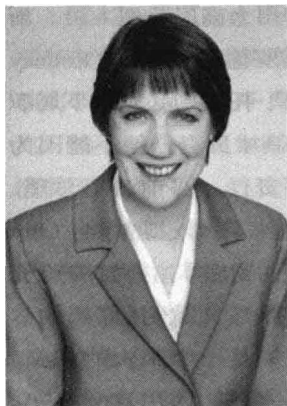
新西兰总理 Helen Clark。