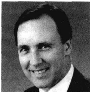
澳洲前工党政府总理 Paul Keating。