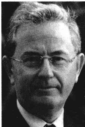
工党政府财政部长 Michael Cullen。