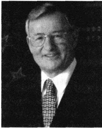
新西兰原政府总理、现任国家邮政总局主席 Jim Bolger。