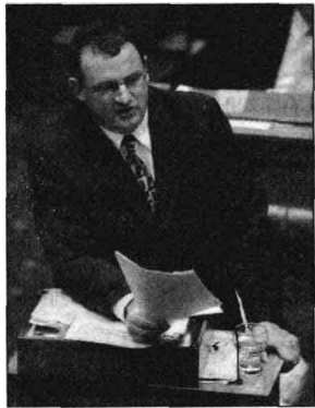
工党政府国家服务部长 Trevor Mallard。

2002年底，一个名为“国际透明度”的组织发表了一份年度调查报告。报告显示，在该机构调查的104个国家中，新西兰与位于北欧的丹麦获得9.5的高分，并列第二名；第一名为北欧的芬兰，获得9.7的高分。于是，该组织将这三个国家称为世界上“最廉洁的国家”。