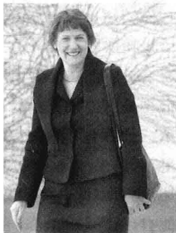
新西兰政府总理 Helen Clark。

迈克尔·库伦博士还抱怨说：“我根本不知道‘新西兰太平洋道路公司’是一个什么样的公司，但是我可以用最强烈的措词表态，任何参加这个机构的公司都不可能获得‘第一羹汤’的优先权。他们也不可能在政策制订过程中得到什么便利。”他还强烈否认政府有任何建立“国家基础设施建设理事会”的计划。