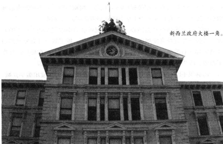
新西兰政府大楼一角。

新西兰国会下属的社会服务委员会最近公布了社会发展部2001年至2002年的财务运作状况，报告显示，该部门的官员在2002年下半年的6个