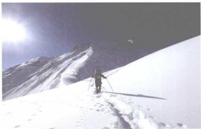
在珠穆朗玛峰攀登途中。