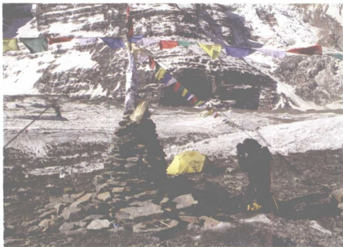
道拉吉里峰出发前的祈祷。