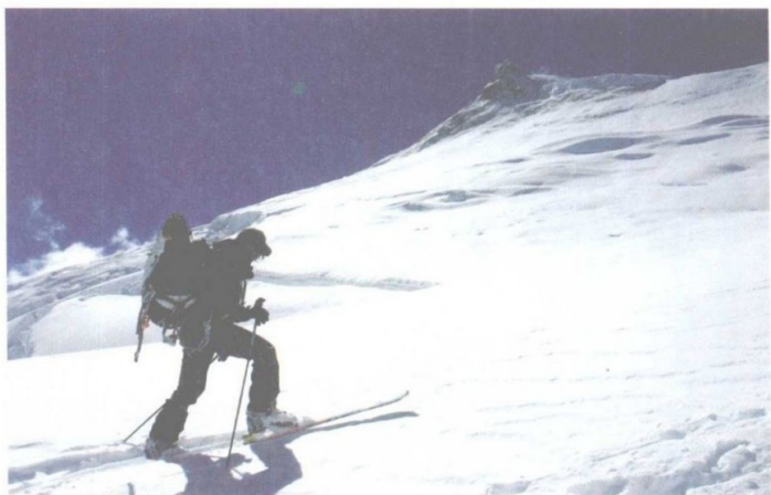
带着滑雪装备攀登世界第八高峰马纳斯卢峰（8163m）。