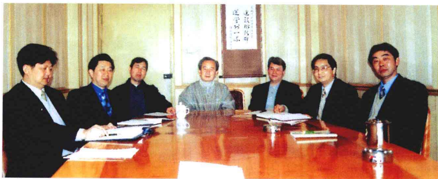
达成公司团结奋进、勇于开拓的领导班子。