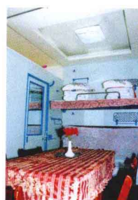
整洁舒适的“多功能”卧铺包房

合发文号召全国铁路企业向达成公司学习，四川省委省政府也在全省掀起了“搞活国企学达成”的热潮。