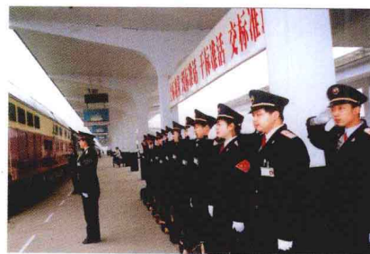
一丝不苟的客运员工队伍