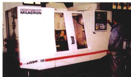
从美国引进的用于接触网配件生产的CNC加工中心

的三套接触网配件锻造生产线顺利投入生产；接触网配件生产设备、工艺技术和主要受力件的技术标准达到了国际同类产品先进水平；以锻代铸的新型接触网零件越来越多，定位环、长定位环等5种新型模锻接触网零件列入国家重点新产品计划。