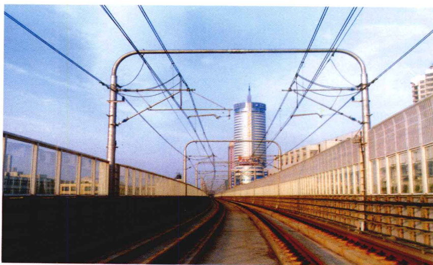
由电气化工程局施工的我国第一条城市轨道交通——上海明珠线

“十五”规划的制定与实施，将进一步缩小我国电气化铁路同世界先进水平的差距，展示出电化局和中国电气化铁路美好的发展前景。