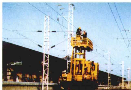
电气化工程局职工在伊朗德黑兰——卡拉季电气化铁路中施工。这是我国电气化技术第一次整体输出。

设计施工的上海地铁1号线、2号线、广州地铁1号线牵引供电工程先后于1998、1999年投入运行，上海地铁3号线和广州地铁二期工程已于2000年开通运行。电气化器材、零配件的生产实现了更新换代，质量明显提高；利用外资引进