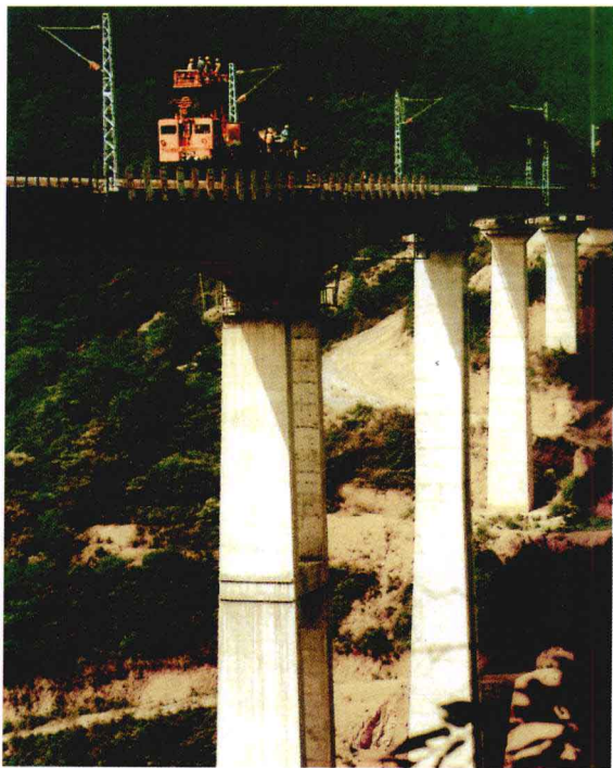
电气化工程局职工在南昆线喜旧溪大桥上作业

平，它是进入国际市场的必备技术。通信联调方面已形成规模能力，先后完成了京九、兰新、宝中、南昆等7000多公里的干线联调任务，其电信研究试验中心通过了国家实验室认证和认可，可承担国内外大型通信信息项目的检测和技术咨询。接触网配件生产已达到国际水平，并开始进入国际市场，其检测中心也通过了国家实验室认可，与12个国际同类实验室互为认可。