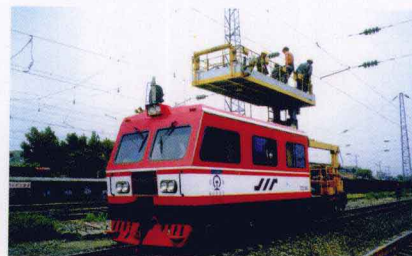
接触网检修作业车

该厂通过了ISO9001质量体系国内认证和英国UKAS国际认证,并将始终按照“设计安全先进、制造精益求精、服务至诚至信,是我们永无止境的追求”的质量方针,为国内外顾客提供过硬的产品和满意的服务。