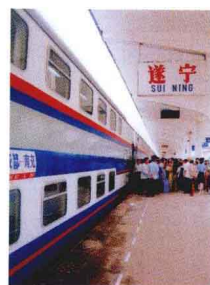
达成铁路的高档次旅客列车

达成铁路有限责任公司——西南铁路首家合资的现代企业，仅用两年多的时间，就使达成铁路发生了根本性变化，首开全国新线铁路运营不亏的先河。公司347公里铁路目前仅有员工不足1000人，平均每公里28人的管理水平已处于世界领先地位。达成公司无论是在经营管理还是在机构改革和体制改革方面，都取得了不少成功经验。1999年10月29日，铁道部部长傅志寰视察了达成铁路以后，对达成公司给予了很高评价，铁道部、铁道部政治部联