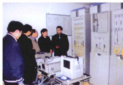
电气化工程局所属的经国家技术监督局认证和国家实验室认可委员会认可的电信研究试验中心