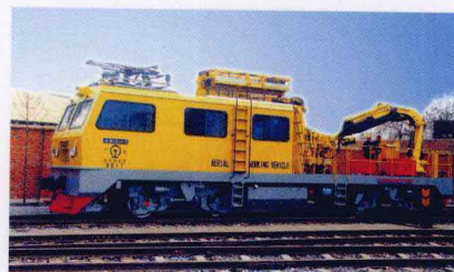
接触网高空作业车