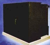
组合式变压器-美式箱变