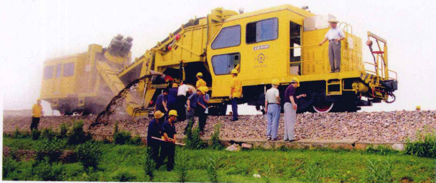
全断面道碴清筛机

襄樊轨道车辆工厂是目前国内重型轨道车辆,电气化铁路施工、维修、检测车辆及大中型养路机械设备的主要生产厂家之一。改革开放20多年以来,工厂已从一个开工不足的装卸机械厂发展成为一个年销售收入近2亿元的专业制造厂家,销售收入增长175倍,固定资产增长15倍,实现了工厂持续、稳定的发展。