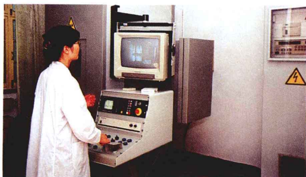
利用从德国引进的X射线探伤仪对产品进行探伤检测