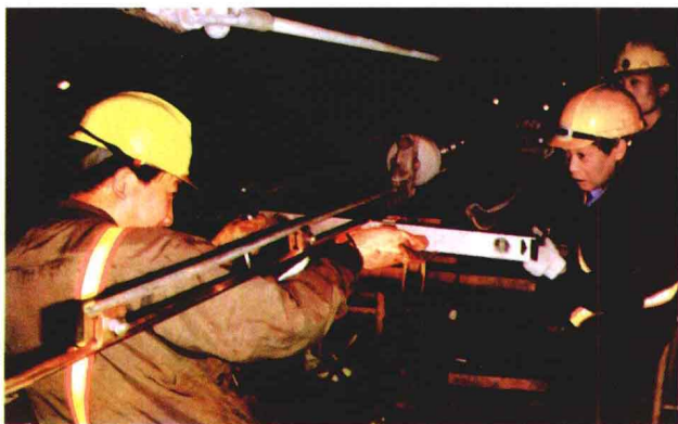
电气化工程局职工在香港广九铁路接触网换线工程中

作为国家级的专业队伍，电化局在高速电气化技术、防干扰技术、城市轨道交通、通信联调、接触网配件生产等方面处于国内领先地位，有的已接近或达到国际水平。电化局自主开发的“高速电铁弓网关系模拟软件”，可以全真演示接触网动态受流情况，此软件已达到国际水