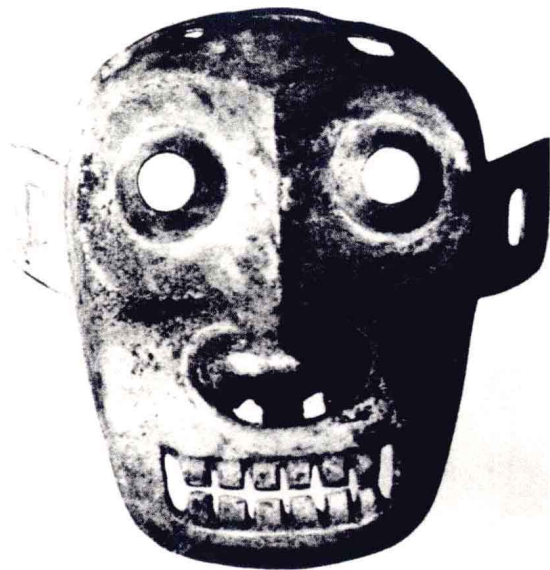
商代战争面具（陕西 城固）

面具是一种世界性的、古老的文化现象，是一种具有特殊表意性质的象征符号。面具渊源于原始先民的狩猎活动、部落战争、图腾崇拜和巫术仪式，其产生的确切时间学术界尚无定论，根据考古材料和史籍记载，当不晚于新石器时代。作为人类物质文化和精神文化相结合的产物，面具在历史上被广泛运用于狩猎、战争、祭祀、丧葬、乐舞、戏剧、镇宅、装饰……具有人类学、民族学、民俗学、历史学、宗教学以及雕刻、绘画、舞蹈、戏剧等多学科的研究价值。