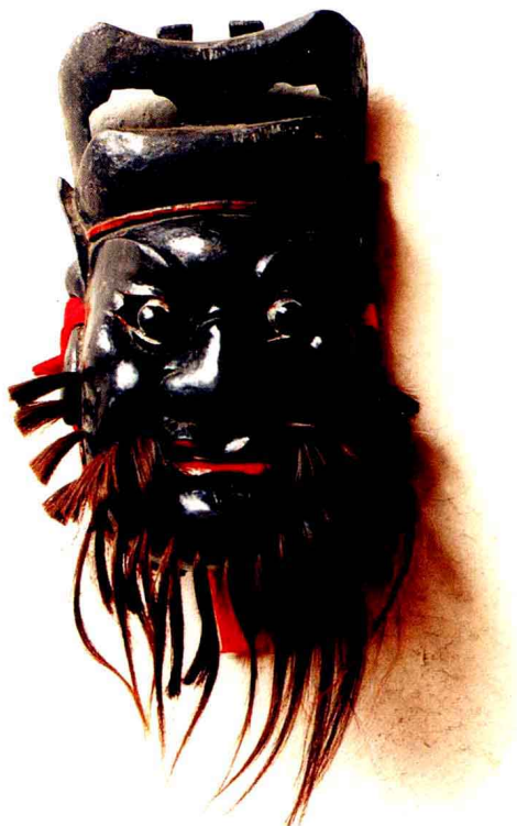
傩舞钟馗面具 (江西 萍乡)

傩戏是中国戏剧家族中一个庞大的种群,它不仅分布极为广泛,而且品类十分繁富。过去,由于学术界对傩戏缺乏一个大体统一的认识,因此常将其他戏剧、乐舞