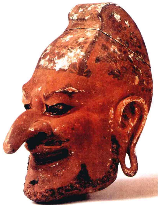
中国传入日本的伎乐面醉胡王（日本奈良时代）