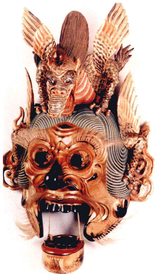
中国传入日本的舞乐面兰陵王（日本江户时代）

钟馗、小妹、土地、灶王等角色，共千余人，“自禁中驱祟出南薰门外，转龙湾，谓之‘埋祟’”。孟元老的记载表明：自商周以来驱傩的主角方相氏已从北宋宫廷傩中消失，从汉至唐一直没有中断的傩子队伍也不复存在，取而代之的是千余名化装成不同角色的驱傩队伍，他们佩戴的面具形貌各异，这与唐代500名傩子皆佩戴同一类型面具的做法迥然不同。对此南宋陆游的《老学庵笔记》可以作为旁证：“政和中大傩，下桂府进面具。比进到，称‘一副’，初讶其少；乃是以八百枚为一副，老少妍陋，无一相似者，乃大惊。”南宋时宫廷傩的规模亦不亚于北宋，面具又增加了六丁六甲神兵、五方鬼使等角色，显得更加丰富多彩。宋代的民间傩俗称“打夜胡”，多在春节期间进行，由贫丐者装扮成鬼神、判官、钟馗、小妹等角色，“敲锣击鼓，巡门乞钱……亦驱傩之意也”。（南宋吴自牧《梦粱录》）为吸引观者和取悦施主，行傩者自然要表演一些带有逐除性质和娱人色彩的傩舞，并念唱一些祈福纳吉的祝辞，这种有舞有唱的表演已经非常接近傩戏，或者说已经具备了傩戏的雏型。