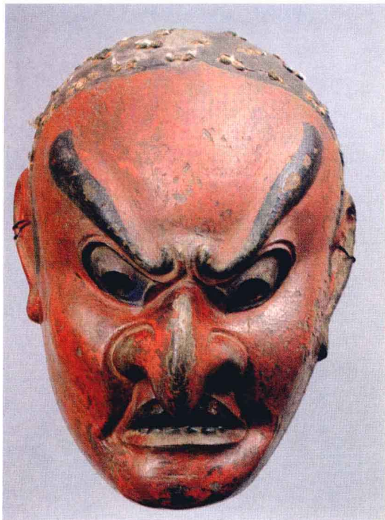
中国传入日本的舞乐面拔头（日本镰仓时代）