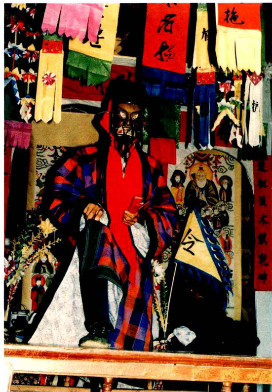
傩堂戏《判官勾簿》 (贵州 岑巩)