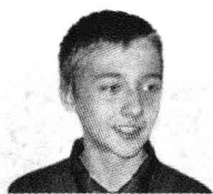
Олег Художественное училище