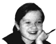
Аня Педагогический университет (师范大学)