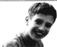
Саша Медицинский институт (医学院)

2) Саша выбрал профессию врача, поэтому после школы хочет учиться в медицинском институте.