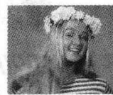
Ира Театральное училище