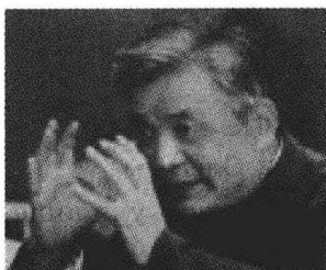
Физик Дэн Цзясянь