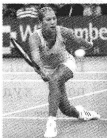
Теннисистка А. Курникова