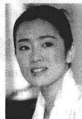
Артистка Гун Ли