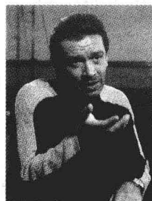
Артист и режиссёр В. Машков