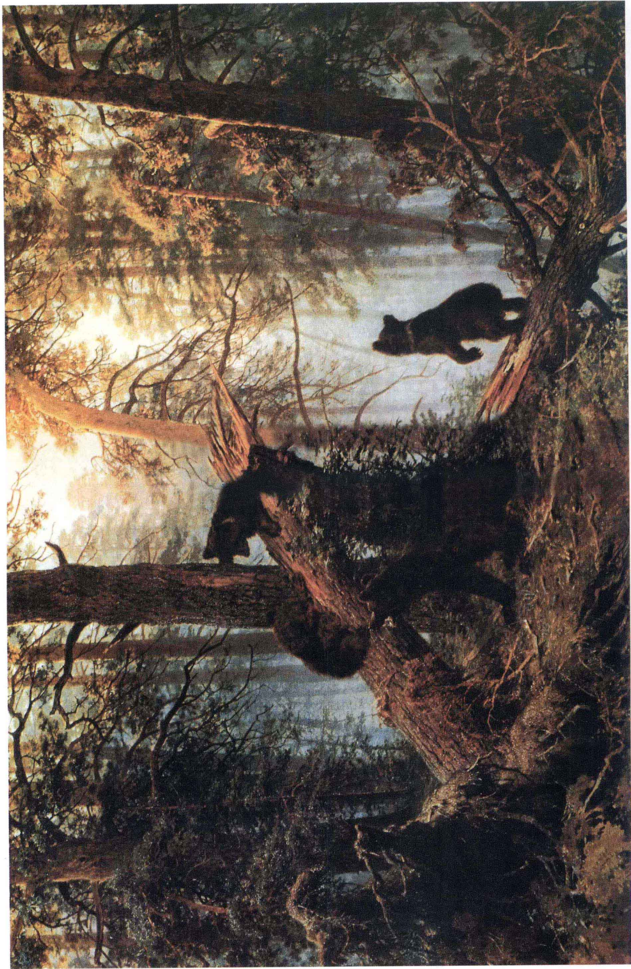
«Утро в сосновом бору» И. И. Шишкин