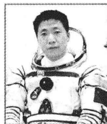
Космонавт Ян Ливэй