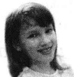
Настя Литературный институт имени Горького