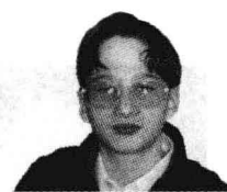
Лера Музыкальное училище