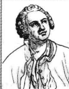
М. В. Ломоносов: физик, химик, математик, астроном, историк, геолог, поэт