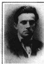
В. В. Маяковский: поэт, художник, артист

В. В. Маяковский был не только поэтом, но и художником, артистом.