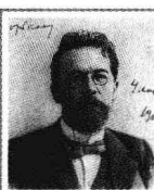
А. П. Чехов: писатель, врач