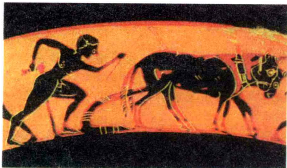
正在耕作的希腊农民

独占了国家全部官职。当权的氏族贵族占有大量土地，剥削和奴役贫困的氏族成员，甚至把他们卖到外邦为奴。