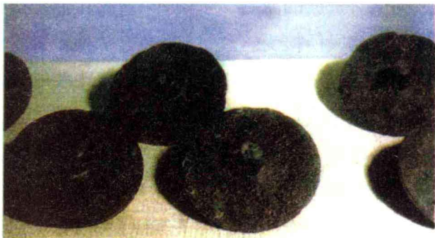
雅典公民投票用的金属小圆盘

雅典的萨拉米岛被麦加拉侵占后，雅典贵族禁止人们提及这个耻辱，违令者斩。梭伦是一位爱国且具有远大抱负的青年，对禁令万分愤慨。他天天站在雅典广场的大石头上，朗诵他的哀歌体诗《咏萨拉米》，号召人民夺回宝岛。他的言行感动了人民和贵族，他被任命为军队的统帅，随即对麦加拉宣战。在梭伦的率领下，全体将士斗志高昂，一举打败了麦加拉，萨拉米岛重新回到雅典的怀抱。梭伦成了雅典的民族英雄。