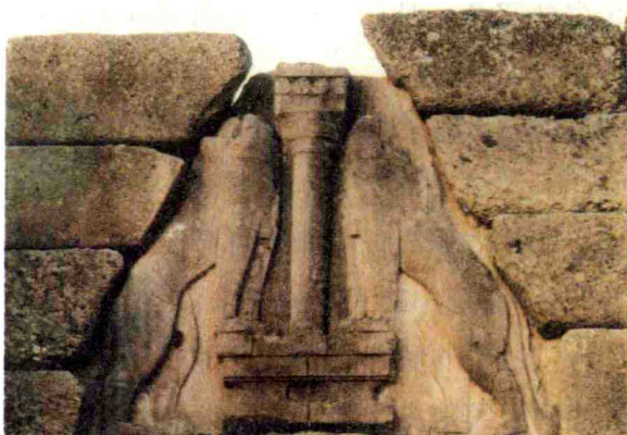
迈锡尼建筑中的狮子门

至伯罗奔尼撒半岛等地，毁灭了迈锡尼文明，使希腊进入了黑暗的荷马时代（公元前11~前9世纪）。公元前9~前6世纪，铁器在希腊广泛使用，经济得以迅速发展，贫富分化日趋严重，开始出现奴隶制。古代希腊由于各地经济发展不平衡，除了数百个城邦并存外，也出现过一些城邦联盟。