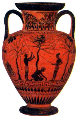
绘有采摘橄榄场面的雅典陶瓶

成，参与例行审判，接受上诉案，并用投票方式判案，实际上就是最高法院。这就改变了贵族会议大权独揽的局面，公民大会成了最高权力机关，400人会议和陪审法庭取代了贵族会议的大部分权力。