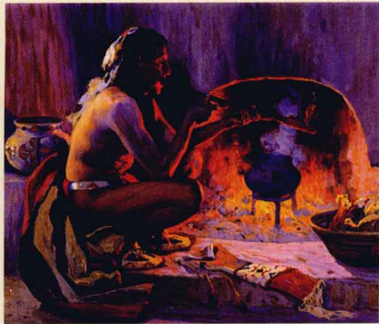
吸烟斗的印第安人

烟草在植物学分类上属于茄科烟属，起源于中、南美洲。世界上最早吸食烟草的无疑是美洲大陆的印第安人。印第安人吸食烟草是源于他们的宗教活动之需，其时的人们，在祭祀时点燃烟草。燃烧的烟草能够散发出醉人的香气，能够提神解乏，甚至还有镇痛治病的功效。因此，很快印第安人就不再把吸食烟草仅仅作为宗教活动中所需的仪式，而在他们的日常生活中推广开来。