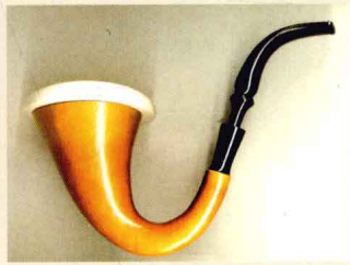
内钵为海泡石的葫芦烟斗