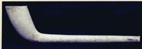
古老的欧洲陶土烟斗

最早的现代意义上的烟斗是陶土烟斗。陶土烟斗制作工艺简单，价格低廉，所以一经出现就获得了广泛的认可，受众甚广，但陶土烟斗也有着其自身无法规避的缺