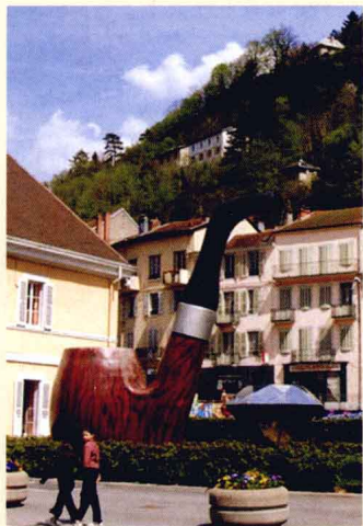
矗立在法国圣克劳德城内的 硕大的烟斗

石楠根烟斗的出现是烟斗发展史上一个划时代的革命事件，石楠根烟斗以其外表的美观，内在良好的吸烟品质，以及相对低廉的价格，一经出现，就立刻在各个阶层的烟斗使用者中引起了强烈的反响，由此一发不可收拾，在其后将近两个世纪的时间里，风行世界，历久不衰。