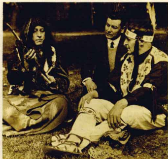
印第安酋长以烟斗待客

当烟草和烟斗传入欧洲之后，吸烟最初还只是流行于上流社会，当时的王公贵胄们把吸烟当做一种时尚和