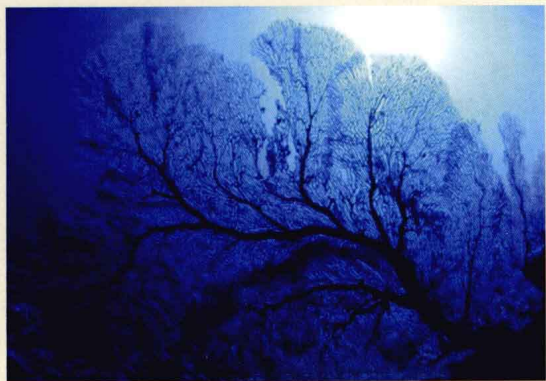
生长在海底的海柳