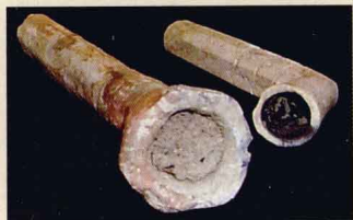
出土的印第安人陶质烟斗

日常生活，吸烟方式和烟具的简便成为人们追求的目标，于是，“原始烟斗”经过逐渐的演变，进化成现代意义上的烟斗，烟具的简便易操作又反过来刺激了烟草吸食流行，于是，吸烟成为印第安人生活中不可或缺的一件事情，无论男女老幼都乐此不疲。