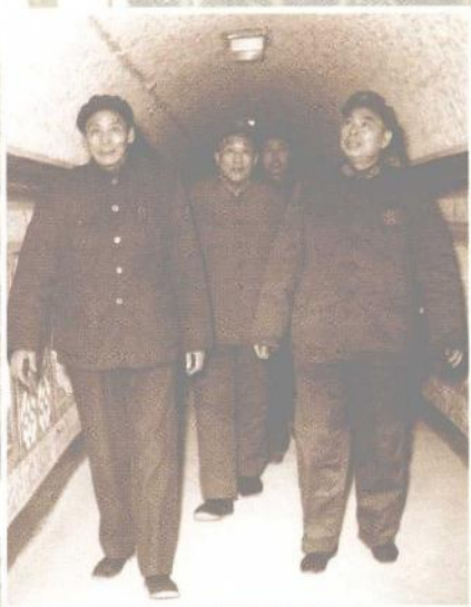
1978年任安徽省军区司令员时，在安徽视察人防工事。

1983年离休后，老红军不忘发挥自己的余热。这是应邀给少先队员作传统报告，受到热烈欢迎。