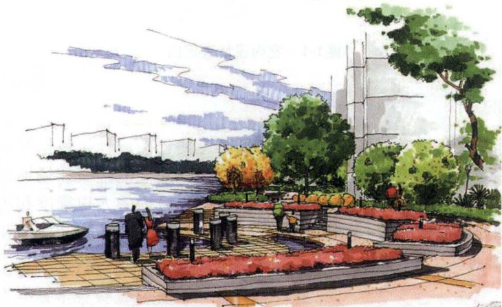
图1-3 园林设计表现图

园林设计包括古典园林设计和现代园林设计，比如公园设计、小区园林设计、绿化植被设计、园林雕塑景观设计等，是对满足人们休闲娱乐的户外活动场所的设计，如图1-3所示为园林设计表现图。