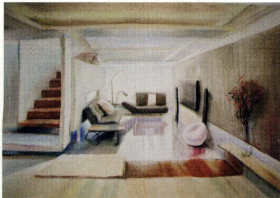
图1-7 手绘设计表现图

准确的空间形体造型能力、清晰的透视概念，可以通过结构素描得到练习；活跃的思路、快速的表现方法，可以通过大量的速写得到练习和锻炼；丰富敏锐的色彩感觉和配色，要有色彩构成知识和色彩写生、记忆默写练习作基础。只有在完成了以上三项大量的练习后，才能为日后画好手绘表现图打下扎实牢固的基础。如果只是掌握一些简单的程式化画法，没有深厚的基础打底，在达到一般的水平后，就很难有所提高了，如图1-7所示为手绘设计表现图。