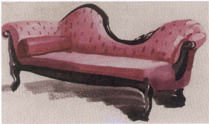
图1-4 家具设计表现图

家具设计包括室内家具和室外家具设计,是指为满足人们在不同场合和空间中生活起居、工作、休闲娱乐等一系列活动所需的家具设备的设计。家具设计的功能性很强,常用的椅子、柜子、桌子、床等和人们生活起居密切相关的单体设计,除功能外还要满足艺术性和审美性的需要,如图1-4所示为家具设计表现图。