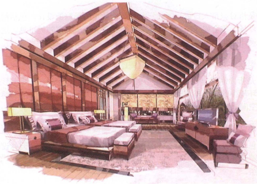
图1-1 室内设计表现图

室内设计是指所有的室内空间的装饰装修设计,包括住宅居室、办公空间、商业空间、娱乐休闲空间、餐饮空间等,即对这些不同功能的空间进行合理划分和运用不同色彩的装饰材料来设计不同感觉的空间氛围。室内设计既是设计师体现自己的设计风格和设计品位的主要阵地,又是设计师展现自己的舞台,图1-1所示为室内设计表现图。