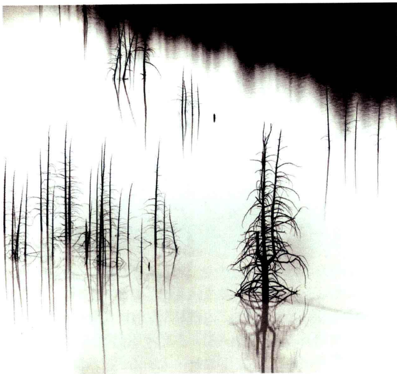
图 1-2-1 安塞尔·亚当斯《树》

光学记录带来的真实，是绘画难以企及的，它对现实景象的记录还原度极高，摄影影像中传递的信息也更丰富，这种类似肉眼的记录让观者极度信任，有“眼见为实”之感。艺术摄影中光线、色彩、角度、瞬间等艺术造型手段的运用即可以强化摄影的“真实”，也可以使影像变得“主观”，艺术摄影的魅力在影像的真实与虚幻中产生。(图 1-2-1)