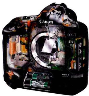
图 1-1-3 照相机结构示意图

摄影的技术性更多的是体现在每个摄影者使用相机拍摄的过程中，光圈、快门的配合，镜头、焦距的调整，闪光灯的使用等问题，都是困扰摄影初学者的难题。这些技术性难题一度曾阻碍了摄影的普及，并使得许多人对摄影的认识，向“唯技术性”观念偏离。但又是技术的发展改变了这一切，特别是数字技术、数码相机的出现改变了“摄影等于复杂技术”的观念，相机变得越来越便捷易用。用“智能化的技术”掩盖了“复杂的技术”，摄影才可以被普通人运用，得以大规模的普及，进而带动社会文化进入了视觉时代。