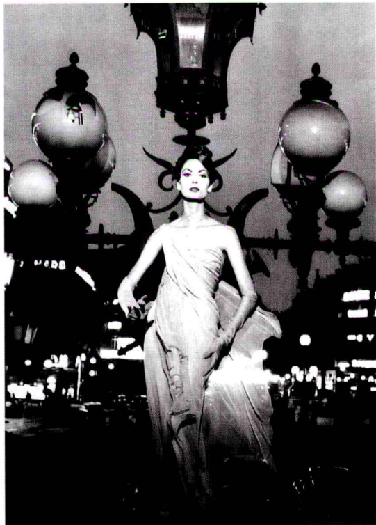
图 1-1-2 威廉·克莱因《时装》