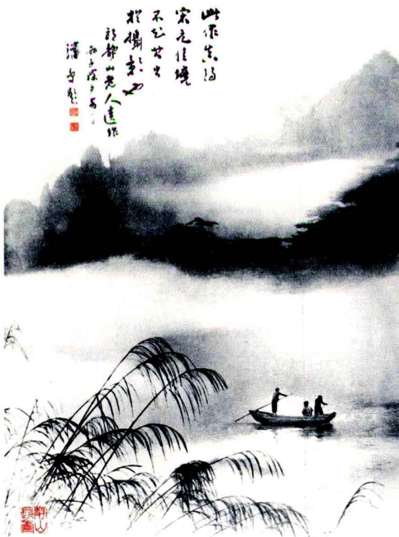
图 1-1-1 郎静山《江山烟云》