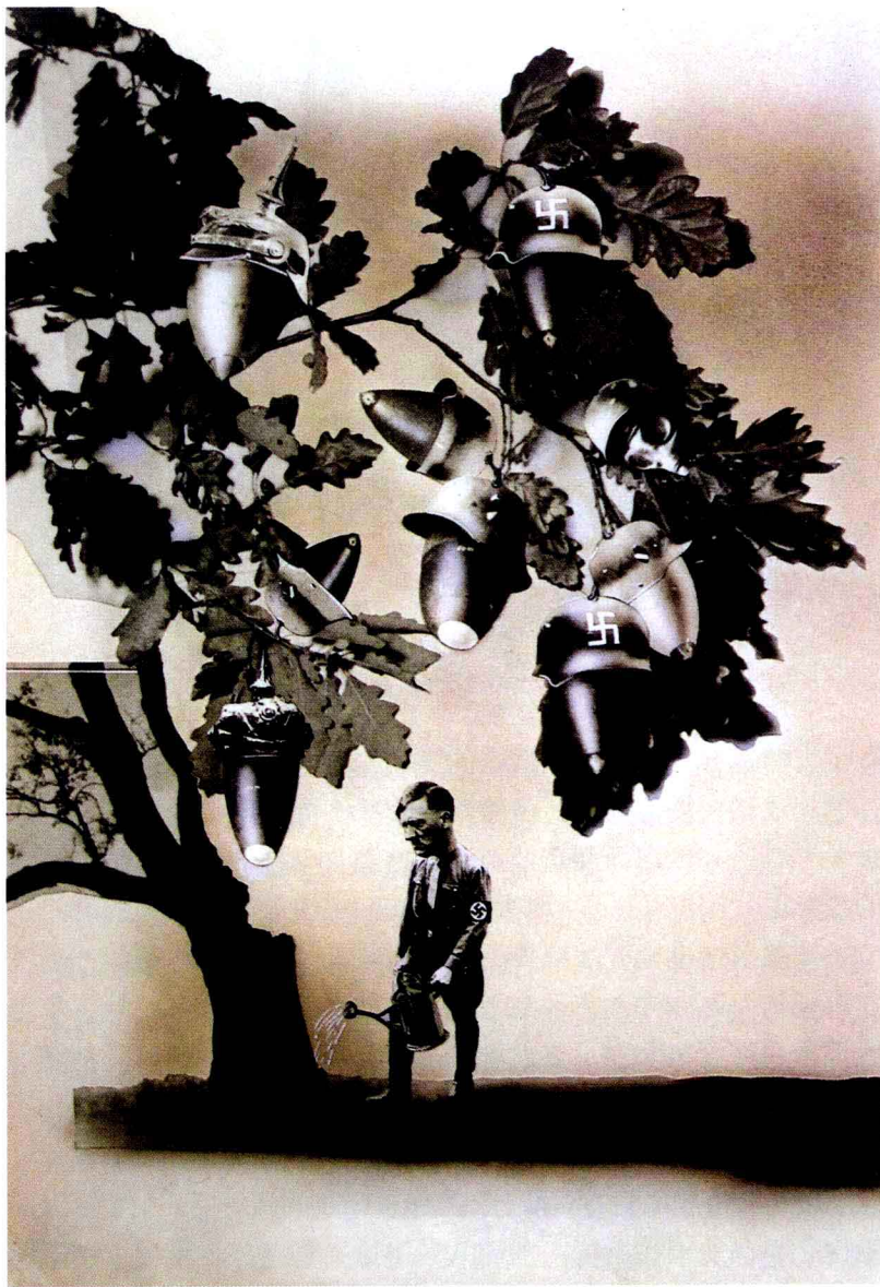
图 1-1-7 约翰·哈特菲尔德创作的讽刺 德国纳粹的拼贴摄影作品

形式不仅拘泥于对现实的艺术化记录，也出现了拼接摄影视觉元素的作品，因其重要的视觉元素是通过摄影手段取得的，而且影像元素的真切感更是形成作品感染力的重要原因。由此，可将此类摄影作品归纳入艺术摄影的范畴，就如（图 1-1-7）约翰·哈特菲尔德的拼贴摄影一样。