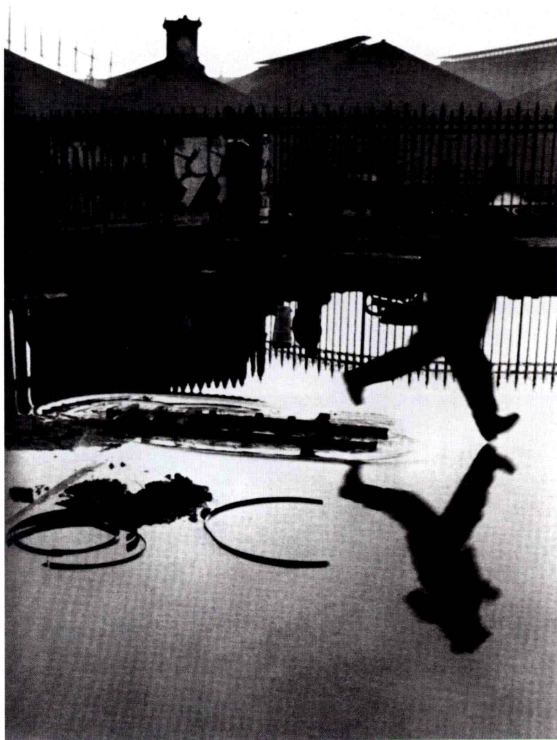
图 1-2-2 亨利·卡蒂埃-布列松作品

摄影的光学记录特性也决定了艺术摄影表现的主体是现实世界的景、物、人，并通过这些主体及相互关系来表达情感、传播思想、创造意境。这也成为艺术摄影表现的技术局限，也是艺术摄影的技术特征之一。这就要求艺术家具有“镜头视觉”、“摄影观察”的能力。