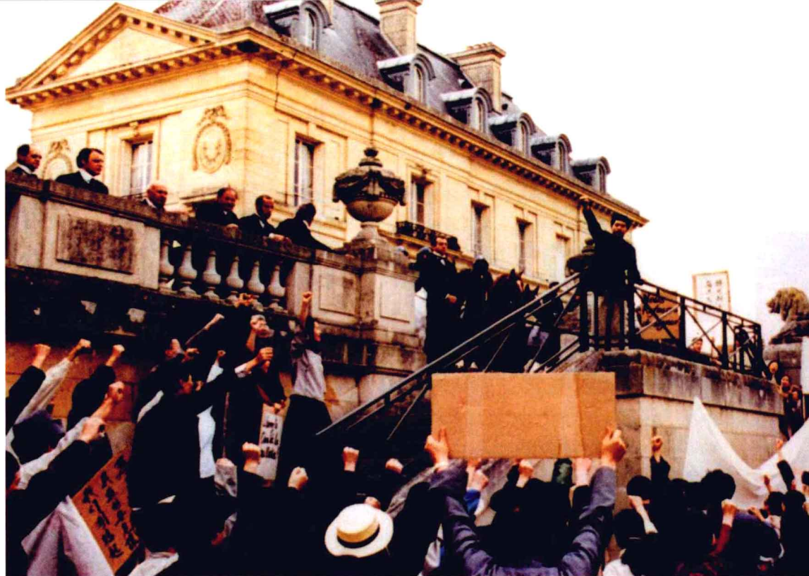
爱国同胞在巴黎集会，抗议帝国主义列强瓜分中国的行径