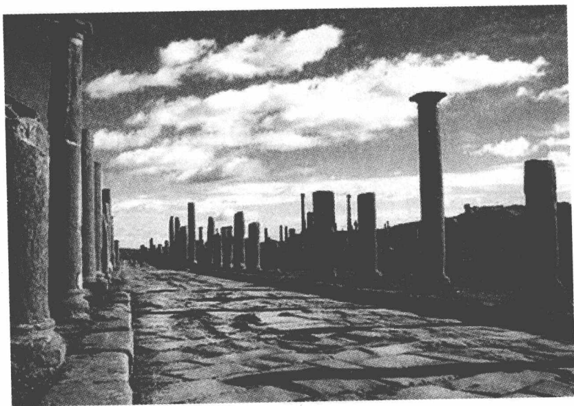
阿尔及利亚——提姆加德古城遗址