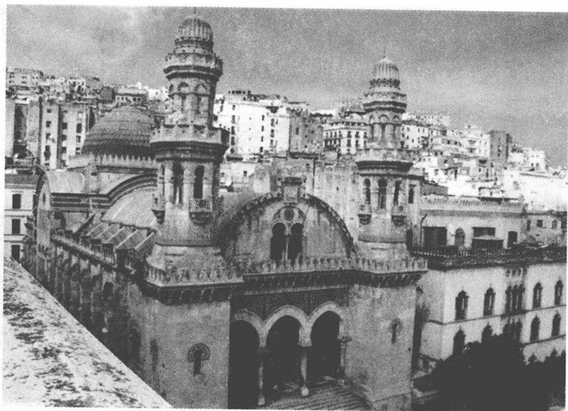
阿尔及利亚首都——阿尔及尔

阿尔及利亚的面积为 238.2 万平方千米。人口为 3600 万(2009 年)。大多数是阿拉伯人,其次是柏柏尔人(约占总人口 20%)。少数民族有姆扎布族和图阿雷格族。语言中官方语言为阿拉伯语,通用法语。其宗教为国教伊斯兰教,穆斯林占总人口的 99.9%,全部属逊尼派。天主教徒 6 万人,犹太教徒 200 人。