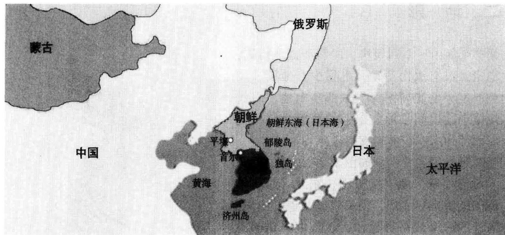
图 1.1 朝鲜半岛在欧亚大陆的位置示意

朝鲜半岛地处亚洲大陆的东部，向南延伸约 1100 千米，位于朝鲜东海（日本海）与我国黄海之间（图 1.1）。韩国位于朝鲜半岛的南部，全称大韩民国，是一个典型的半岛型国家。世界上有几个单独占据半岛大部分地域的国家，如西班牙、意大利、希腊、丹麦等。