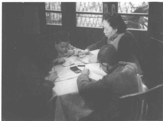
童年时与母亲合影。