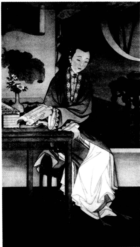
▶ 美丽温婉、娴静典雅的东方女性

今天的女性，能够优雅天成的或许有之，但却犹如凤毛麟角。我们见到更多的则是在庸常生活、扰攘俗世中怀着对美的渴慕却不得其道的女性。今天这个急功近利的时代对于物质的看重，让我们渐渐多了浮躁，少了沉静下来慢品优雅的心境。曾几何时，那些曾经存在于历史时空、诗词歌赋中，浸染着中国古典诗性气质的女子，如班婕妤、谢道蕴、蔡文姬、王昭君、李清照、张爱玲等已飘逝不见。曾几何时，素以美丽温婉、娴静典雅著称的东方女性的特质已日渐式微。