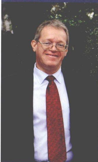
匈牙利驻上海总领事馆 总领事库蒂·拉斯洛